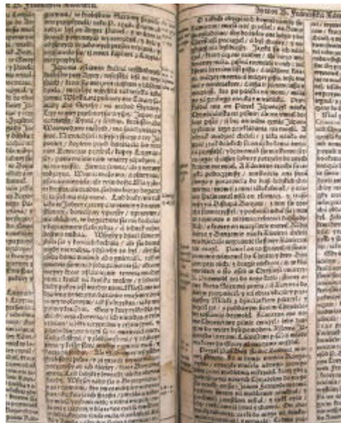
Fot. 2: Japonia ostatnia kraina wschodnich królestw przy Azyey... Piotr Skarga: Żywotów świętych wtora część... Kraków, 1615.

Polacy interesowali się Japonią od dawna. Najprawdopodobniej pierwsze informacje o tym kraju dotarły do Polski w Opisaniu świata Marco Polo, w którym autor nazywa go Zipingu lub Zipangu, od chińskiej nazwy Żi-pen-Kuo (Państwo Wschodu Słońca). Najwcześniejsze wydanie tego dzieła, z tytułem włoskim i tekstem łacińskim, które znajduje się w zbiorach polskich, pochodzi z roku 1483.