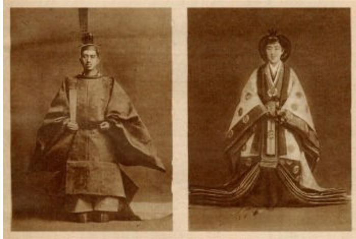
Fot. 6: Cesarz Hirohito z małżonką, cesarzą Kōjun. „Światowid” 1928, nr 50.

Spraw japońskich dotyczyły również opracowania o tematyce politycznej, ekonomicznej i społecznej, i to zarówno autorów polskich, jak i zagranicznych. Dzieła tych ostatnich były tłumaczone na język polski i publikowane przez polskich wydawców. W wielu książkach został opisany konflikt zbrojny między Rosją i Japonią w latach 1904–1905. Wydawano także prace o działalności misjonarzy katolickich w Japonii, o japońskiej kulturze, sztukach walki czy wreszcie relacje podróżników, którzy dotarli na wyspy japońskie. Skala zainteresowania Polaków tak przecież odległym i egzotycznym dla nich krajem była niemała. Pierwszą bibliograficzną próbą ukazania tego zjawiska była Polska bibliografia japonologiczna po rok 1926 Ignacego Schreiberera, która ukazała się w Krakowie w roku 1929. Bibliografia ta zawierała 124 pozycje ułożone alfabetycznie, z indeksem nazw autorów i współpracowników włączonym do zrzębu głównego. W uwagach niektórych opisów zostały podane rozdziały dotyczące Japonii, a w przypadku przekładów tytuły oryginałów oraz informacje o miejscu i dacie pierwszego wydania oryginału.