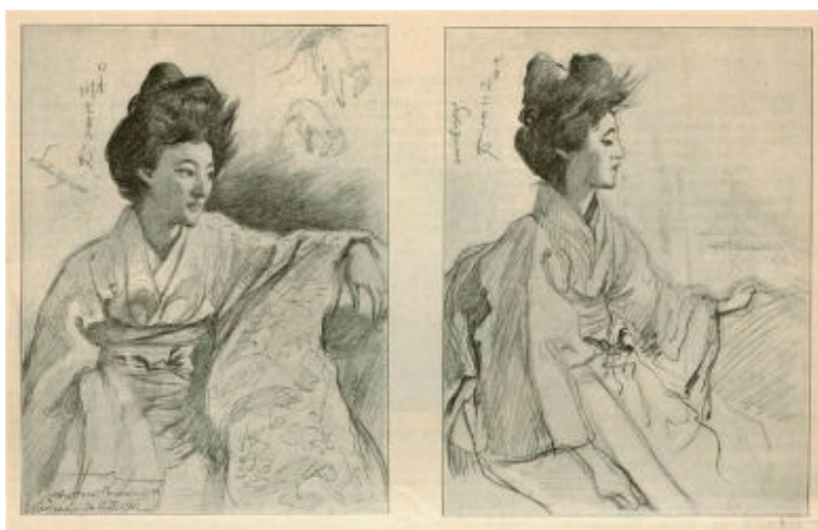
Fot. 5: W 1902 r. odwiedził Polskę zespół teatru japońskiego ze słynną Sadą Yacco. Portrety z natury z autografem artystki. „Tygodnik Ilustrowany” 1902, nr 12.