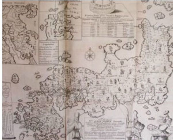
Fot. 1: Mapa Japonii. Engelbert Kaempfer: Histoire naturelle, civile, et ecclesiastique de l'empire du Japon... T. 1, 's Gravenhage, 1729. Zbiory Biblioteki Narodowej.

Polacy interesowali się Japonią od dawna. Najprawdopodobniej pierwsze informacje o tym kraju dotarły do Polski w Opisaniu świata Marco Polo, w którym autor nazywa go Zipingu lub Zipangu, od chińskiej nazwy Żi-pen-Kuo (Państwo Wschodu Słońca). Najwcześniejsze wydanie tego dzieła, z tytułem włoskim i tekstem łacińskim, które znajduje się w zbiorach polskich, pochodzi z roku 1483.