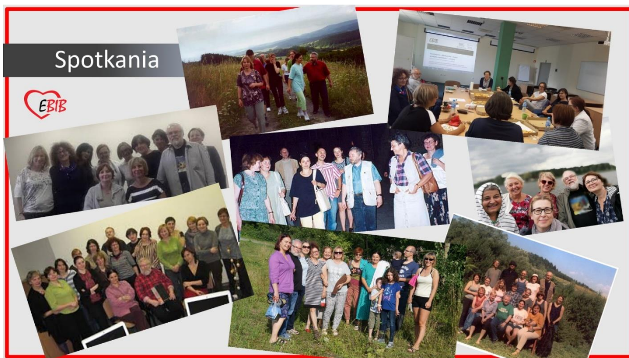
II. 1. Spotkania zespołu EBIB