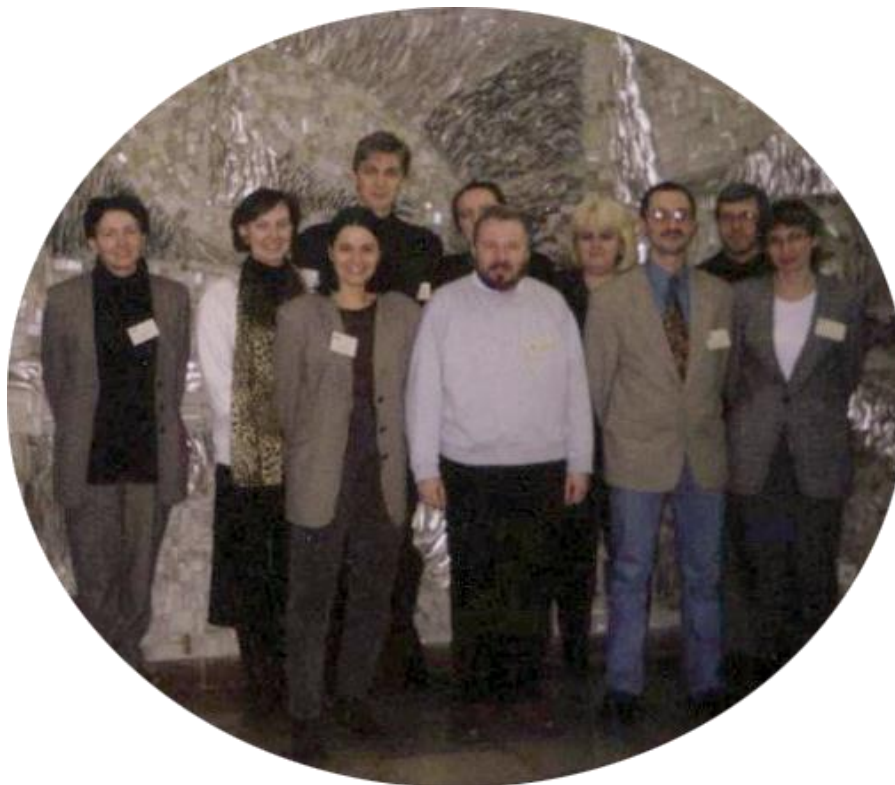
Il. 2. Redakcja EBIB – zebranie założycielskie, 29.01.1999 r.

w 10-osobowym gronie, bez jakichkolwiek funduszy i przy skromnych narzędziach do pracy zdalnej, postawić sobie za cel integrację środowiska zawodowego, budowanie demokratycznego i tolerancyjnego forum dyskusyjnego, szybkie, bezpłatne dostarczanie środowisku bibliotecznemu ważnych profesjonalnych informacji oraz kumulację polskich zasobów internetowych dla bibliotekarzy 4 .