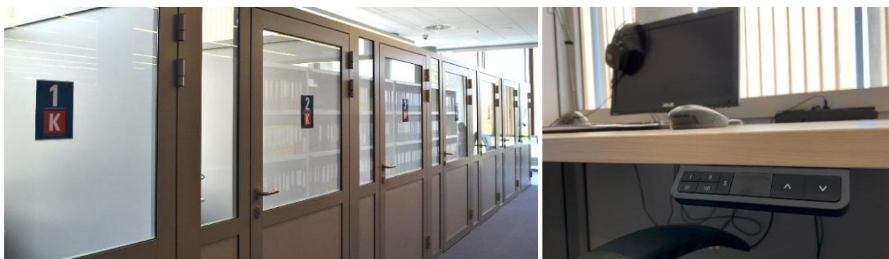
Rys. 2. Kabinety pracy indywidualnej w przestrzeni czytelnicy BPP

Na niedawnym II Kongresie Bibliotek Szkół Wyższych (18–20 czerwca 2024 r., Poznań) wiele razy padało stwierdzenie, że transformacja bibliotek polega między innymi na zmianie, a w zasadzie poszerzeniu funkcji przestrzeni, która dotąd służyła przede wszystkim do eksponowania zbiorów. Obecnie każdy metr kwadratowy biblioteki jest dla użytkownika dużo cenniejszy jako miejsce pracy, spotkania, dyskusji, a nawet po prostu odpoczynku, dlatego nikogo nie dziwi imponująca statystyka korzystania zarówno ze wspomnianych kabin, jak i powstałych wcześniej pokoi pracy zespołowej (rys. 3) oraz obszernego pomieszczenia zwanego potocznie chilloutem (rys. 4).