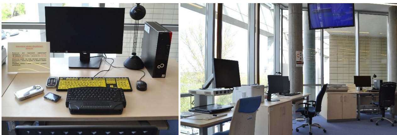
Rys. 1. Stanowisko dla osób ze szczególnymi potrzebami z przykładami specjalistycznego wyposażenia; czytelnia BPP

Ponadto 17 lipca 2020 r. weszło w życie zarządzenia Rektora Politechniki Poznańskiej, dotyczące zapewnienia osobom niepełnosprawnym i ze szczególnymi potrzebami odpowiednich warunków do przyjęcia na studia, kształcenia i prowadzenia działalności naukowej oraz regulamin wydatkowania dotacji na zadania związane z zapewnieniem tejże dostępności (Zarządzenie nr 38 Rektora Politechniki Poznańskiej...). W tym samym czasie zakupiono specjalistyczny sprzęt, który następnie przekazano do Biblioteki PP w celu jego udostępniania potrzebującym. I tak BPP włączyła do swoich usług także i tego rodzaju działalność – pod opieką bibliotekarzy znalazły się: lupy elektroniczne, linijka, klawiatura i notatnik Braille’a, programy udźwiękowiające (wersja Pen Drive), wizualizatory, elektroniczne powiększalniki kieszonkowe Maggie oraz Capture oraz programy powiększające Lunar Plus (wersja Pen Drive).