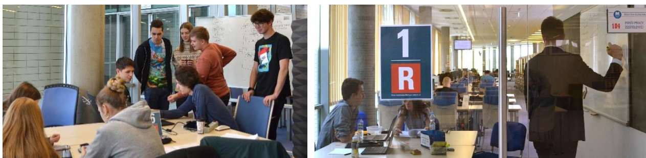
Rys. 3. Przykładowe stanowiska i pokoje pracy zespołowej w przestrzeni wypożyczalni i czytelni BPP