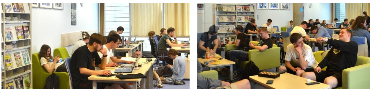
Rys. 4. Strefa relaksu (tzw. chillout) w czytelni BPP