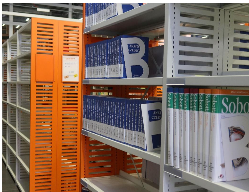
Fot. 3. Początek budowania księgozbioru Biblioteki Medycznej UW

Za przygotowanie księgozbioru nowej biblioteki odpowiadał zespół Biblioteki Uniwersyteckiej. Pracownicy BUW przez całe wakacje intensywnie gromadzili i opracowywali zbiory dla Biblioteki Medycznej, dzięki czemu mogła być gotowa na przyjęcie pierwszych czytelników z początkiem roku akademickiego.