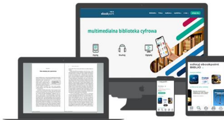
Rys. 1. BIBLIO Ebookpoint

Przez gwałtowny rozwój cyfryzacji, a co za tym idzie, coraz mniejsze zainteresowanie tradycyjnymi wersjami książek, biblioteki publiczne nie są już tak często odwiedzane przez czytelników, jak dekadę temu. Ma to często negatywny wpływ na prosperowanie wielu z nich, co tym bardziej nie zachęca czytelników do korzystania z bibliotek. W takiej sytuacji mogą znacznie pomóc ich dofinansowania i digitalizacja zasobów bibliotecznych.