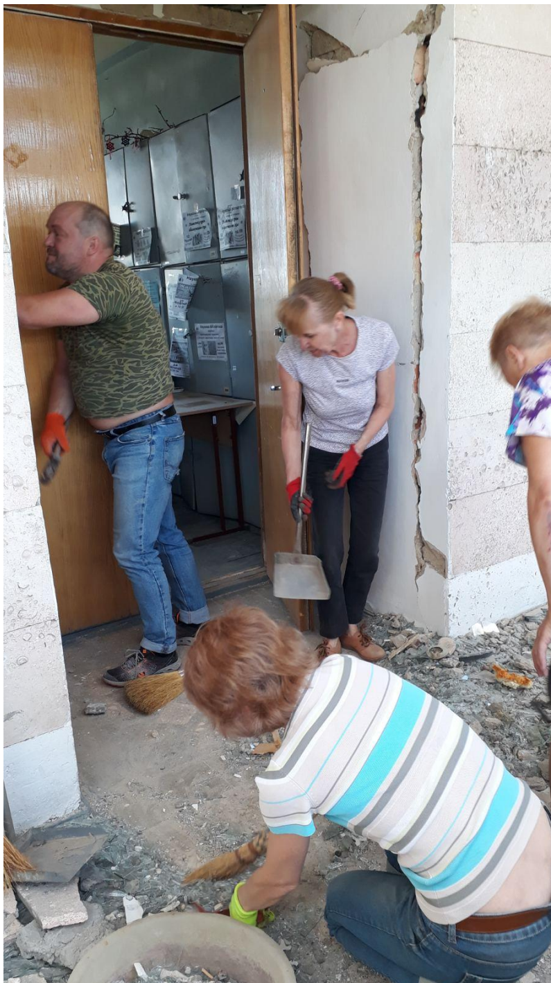
II. 4. Pracownicy biblioteki NUBO podczas usuwania skutków bombardowań

Nie można ujarzmić niezwycięzonych, odbudujemy i przywrócimy przedwojenny porządek, ponieważ gromadzimy się w celu osiągnięcia zwycięstwa! Wierzymy, że tak będzie! Utrzymujemy front informacyjny. Jedność jest naszą siłą i naszym wymarzonym zwycięstwem.