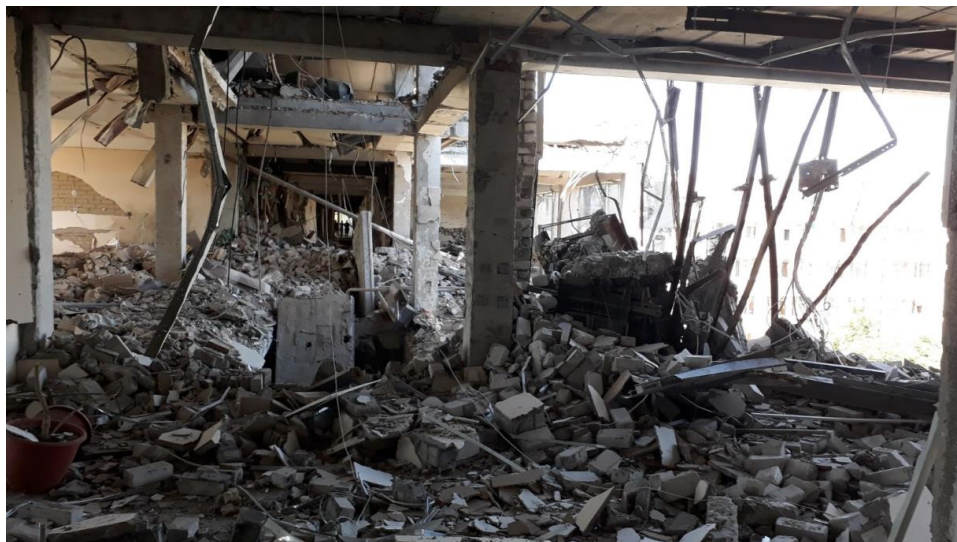
Il. 1. Zniszczenia w pomieszczeniach biblioteki NUBO Fot. S. Larenkowej.

scowione w tym budynku. Wybite zostały prawie wszystkie okna, uszkodzony został dach, częściowo zniszczono pomieszczenia biblioteczne o powierzchni 1022,8 m 2 , uszkodzeniu uległo około 20% zbiorów bibliotecznych, meble i inne elementy wyposażenia biblioteki.