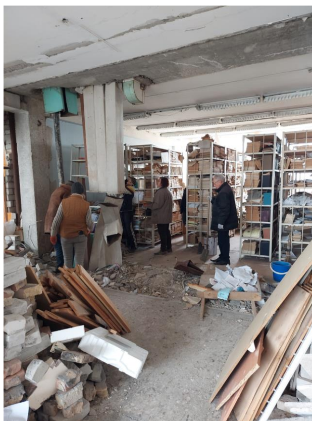
Il. 2. Zniszczenia w pomieszczeniach biblioteki NUBO