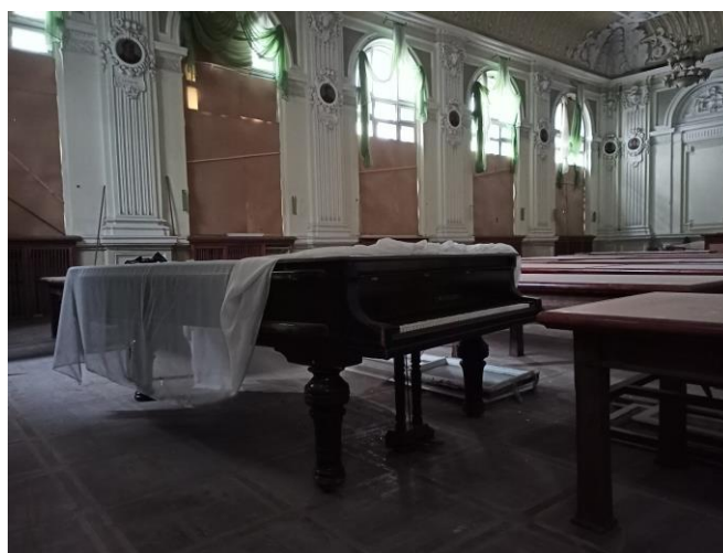
Il. 1. Po wybuchu – duża czytelnia ChPBN

Obecnie niepokój budzą losy ocalałych obiektów dziedzictwa kulturowego i zabytków architektury, które znajdują się w centrum miasta. Wśród nich jest Charkowska Państwowa Biblioteka Naukowa im. W.G. Korolenki (ChPBN) – jedna z najstarszych (założona w 1830 r.) i największych bibliotek w Ukrainie i w Europie. Warto podkreślić, że główny budynek biblioteki został zbudowany w 1901 r. według projektu wybitnego ukraińskiego architekta Aleksieja Biekietowa. Ta majestatyczna budowla z neorenesansową fasadą jest zabytkiem architektury i urbanistyki o znaczeniu regionalnym oraz krajowym. Unikalny księgozbiór obejmuje ponad siedem milionów jednostek magazynowych w 244 językach świata. Instytucja jest międzyregionalnym, uniwersalnym depozytariuszem dla bibliotek obwodu charkowskiego, połtawskiego i sumskiego. W strukturze biblioteki znajduje się 19 działów oraz 13 czytelni, które mogą pomieścić ponad 500 osób. Wśród pracowników jest jeden doktor habilitowany i cztery osoby ze stopniem doktora.