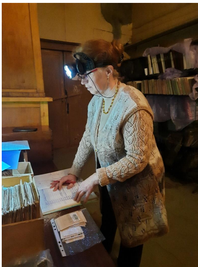
Il. 1. Zespół gromadzenia pracuje w magazynie w podziemiu

Wszystko to zostało zrobione... Ale wprowadzono również działania, które nie mają bibliotecznego celu, są przejawem człowieczeństwa, pomocy tym, którzy walczą na froncie i chronią naród przed inwazją wroga i tym, którzy zostali zmuszeni do opuszczenia swoich domów, aby ratować własne życie. Te działania to np. włączenie się do ruchu wolontariackiego (pomoc humanitarna i psychologiczna, tkanie siatek ochronnych na potrzeby wojska, kursy udzielania pierwszej pomocy itp.), zbieranie środków na potrzeby Sił Zbrojnych Ukrainy itd. Teraz to wszystko tylko rejestrujemy, a po zakończeniu wojny – opiszemy każdy etap tej tytanicznej pracy bibliotekarzy UPUNT w kryzysowych warunkach wojny.