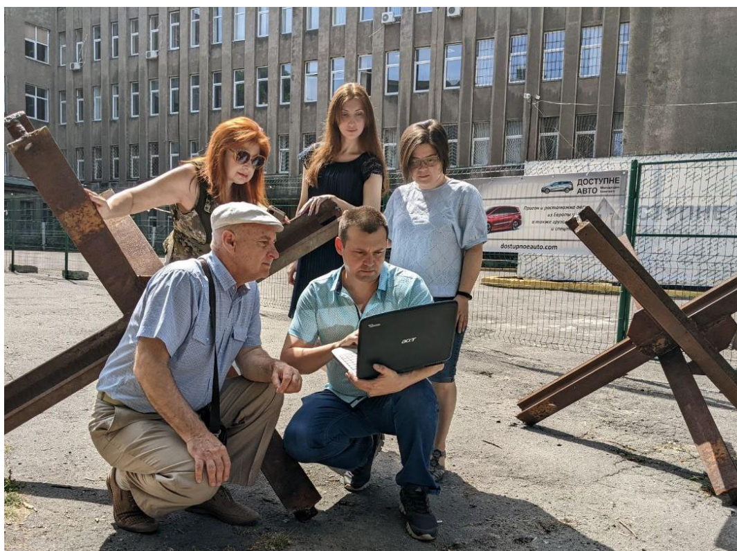
Il. 2. Migawki z pracy bibliotekarzy: spotkanie z wykładowcą dedykowane tworzeniu otwartych podręczników

Dlatego dużym krokiem rozwojowym dla uczelni było pełne wsparcie władz UPUNT i jego rady naukowo-metodycznej, wyrażone już w kwietniu 2022 r., dla działań biblioteki w zakresie rozwoju potencjału tworzenia, wykorzystywania, zmiany profilu, adaptacji i rozpowszechnienia OZE.