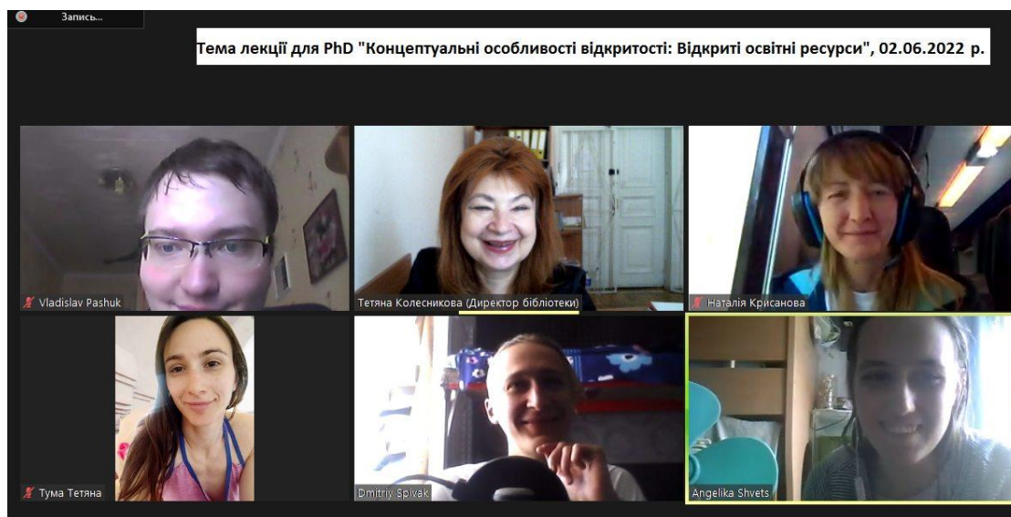
Il. 3. Webinarium nt. OZE dla doktorantów (przebywających w Polsce, Niemczech, Holandii, Ukrainie)

Bibliotekarze UPUNT, jako ambasadorowie otwartej edukacji i otwartych zasobów edukacyjnych, począwszy od 2020 r., już po pierwszych szkoleniach SPARC zaczęli komunikować się formalnie na poziomie uczelni na organizowanych webinarach, spotkaniach z kierownikami katedr, wykładowcami, doktorantami, jak i nieformalnie – z indywidualnymi użytkownikami podczas ich wizyt w oddziałach biblioteki.