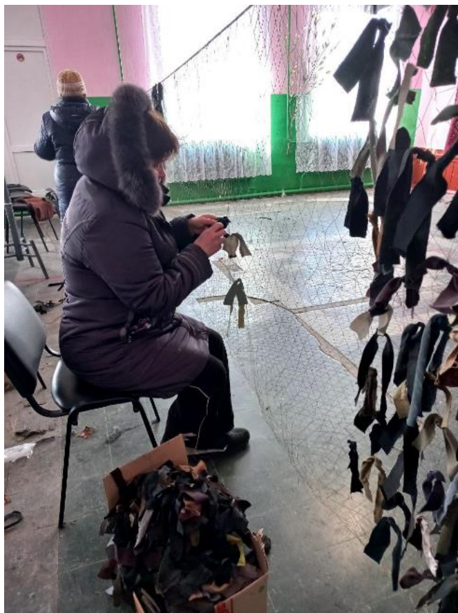
Il. 4. Pracownica Biblioteki Naukowej ChNUM pomaga tkąć siatki maskujące

Od początku wojny, równoległe z działalnością zawodową, pracownicy bibliotek wspierają ruch wolontariacki w Ukrainie – organizują pomoc dla wojska i ludności w zakresie dostarczania żywności, leków, środków higienicznych, wspomagają ewakuację ludności cywilnej do bezpiecznych miejsc, a także tkają siatki maskujące i zbierają środki na potrzeby obrońców Ukrainy.