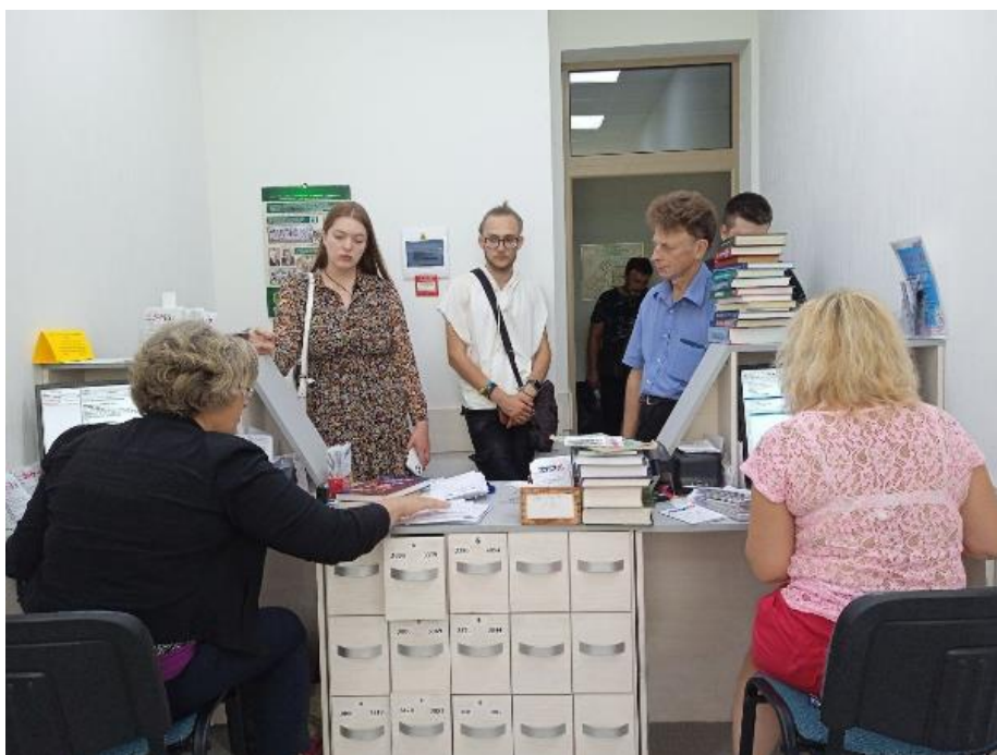
II. 2. Zwrot podręczników przez studentów kończących studia w ChNUM

Dziś Biblioteka Naukowa ChNUM pracuje w formie hybrydowej: część zespołu zdalnie, a 13 bibliotekarzy na swoich stanowiskach pracy. Dopóki jest to możliwe, studentom wypożyczane są podręczniki na nowy rok akademicki, trwają prace w zakresie gromadzenia i opracowania nowych nabytków w katalogu elektronicznym, porządkowania zbiorów, zapewnienia dostępu do zasobów elektronicznych i baz danych, skanowane są rzadkie i cenne zbiory książkowe, prowadzone są konsultacje dla użytkowników oraz inne usługi, które biblioteka świadczyła jeszcze przed wojną.