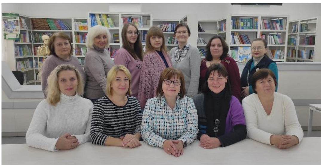
II. 3. Pracownicy Biblioteki Naukowej ChNUM pracujący w czasie stanu wojennego

Dziś Biblioteka Naukowa ChNUM pracuje w formie hybrydowej: część zespołu zdalnie, a 13 bibliotekarzy na swoich stanowiskach pracy. Dopóki jest to możliwe, studentom wypożyczane są podręczniki na nowy rok akademicki, trwają prace w zakresie gromadzenia i opracowania nowych nabytków w katalogu elektronicznym, porządkowania zbiorów, zapewnienia dostępu do zasobów elektronicznych i baz danych, skanowane są rzadkie i cenne zbiory książkowe, prowadzone są konsultacje dla użytkowników oraz inne usługi, które biblioteka świadczyła jeszcze przed wojną.