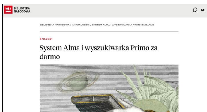
Rys. 10. Informacja o konkursie na stronie BN