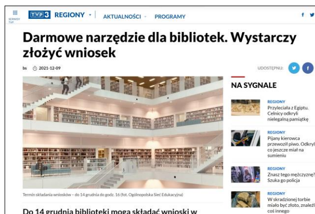
Rys. 11. Informacja o konkursie na stronie Telewizji Polskiej