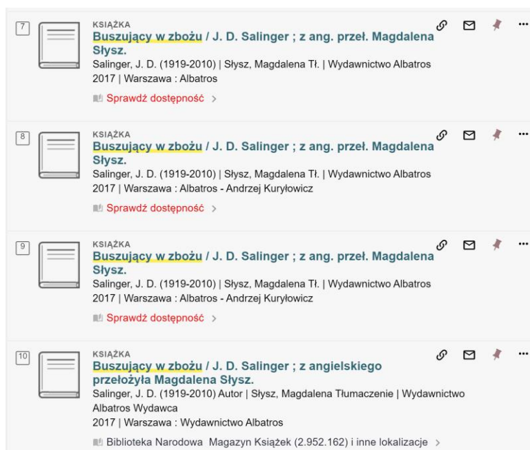
Rys. 4. Wynik wyszukiwania w katalogu BN jednego z wydań powieści Buszujący w zbożu Źródło: Katalog Biblioteki Narodowej [online]. [Dostęp 17.11.2022]. Dostępny w: http://bn.org.pl .