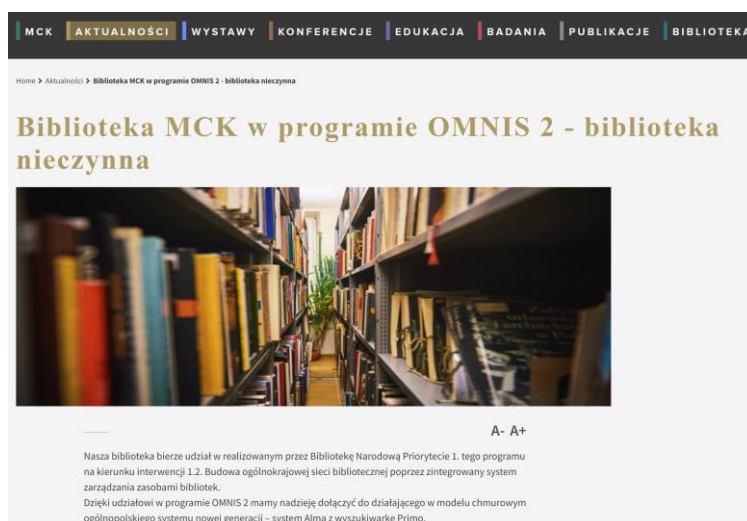
Rys. 2. Informacja o Bibliotece Międzynarodowego Centrum Kultury w Krakowie Źródło: Międzynarodowe Centrum Kultury [online]. [Dostęp 17.11.2022]. Dostępny w: https://mck.krakow.pl/aktualnosci/biblioteka-mck-w-programie-omnis-2 .