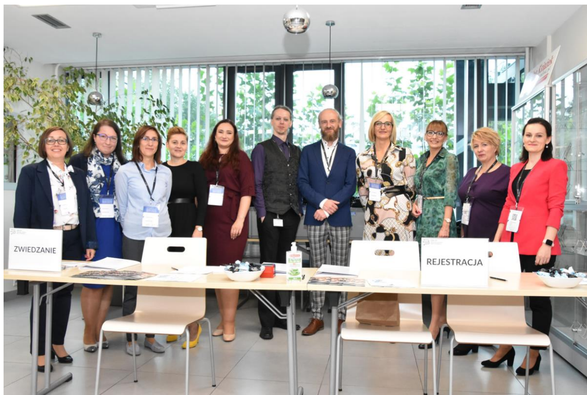
II. 7. Organizatorzy konferencji