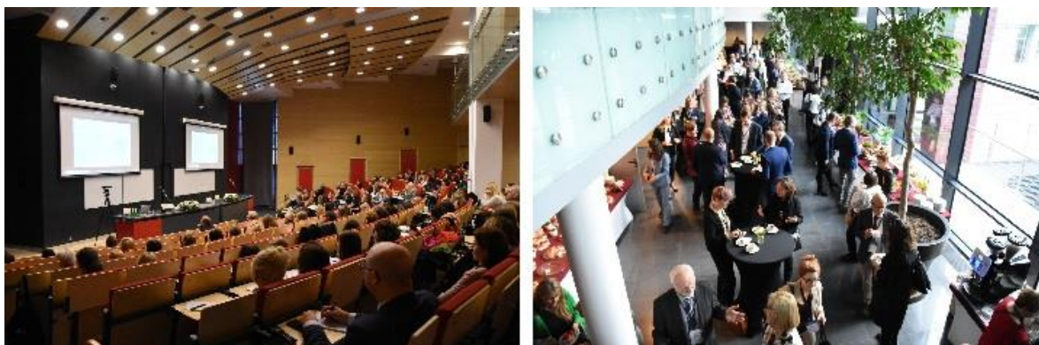
Il. 4. Uczestnicy konferencji podczas obrad

CIB24/7", czyli dostęp całodobowy dla użytkowników. Dyrektor Centrum przedstawił przygotowania do realizacji tego założenia, napotkane po drodze problemy i kroki podjęte w celu ich rozwiązania, a także rezultaty w postaci znacznego i systematycznego wzrostu zarówno liczby użytkowników, jak i wykorzystania zasobów.