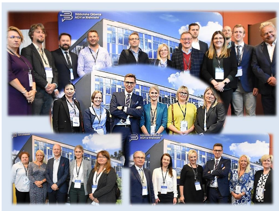
Il. 5. Pamiątkowe zdjęcia z przedstawicielami Rady Programowej, prelegentami i sponsorami konferencji