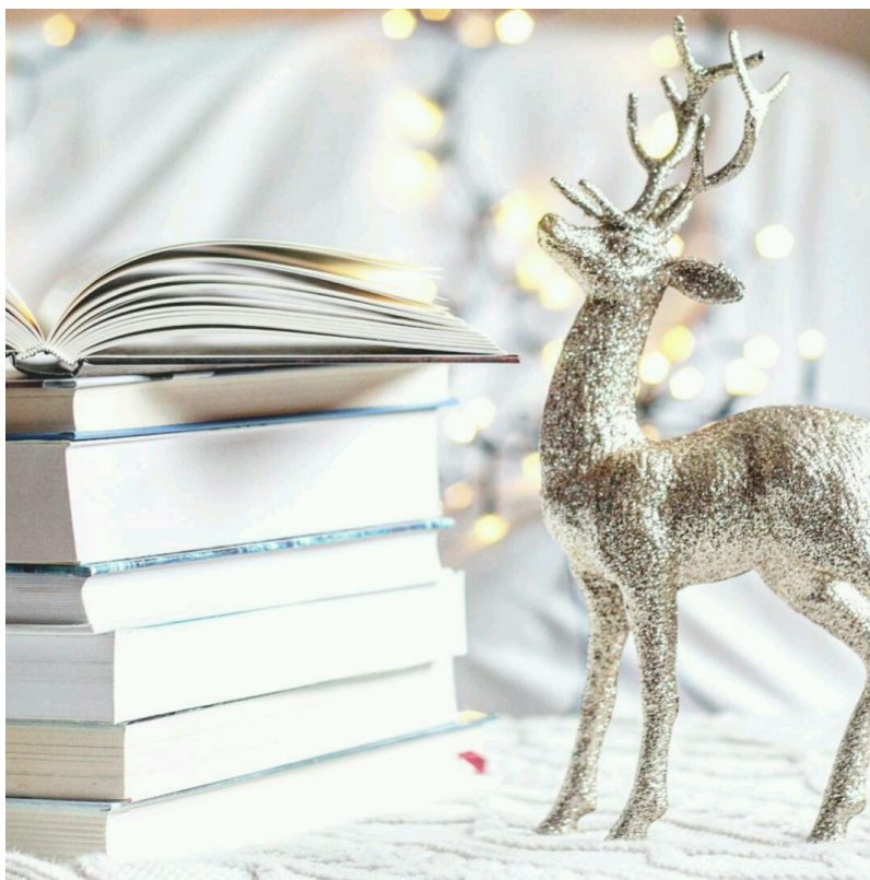
Il. 2. Post w serwisie Instagram.

Posty pojawiają się na nim z częstotliwością jednego, dwóch dziennie. Chmiel, jak sama stwierdza, traktuje Instagram jako sposób na dzielenie się zamiłowaniem do książek oraz źródło inspiracji czytelniczych i fotograficznych. Najwięcej satysfakcji z prowadzenia bloga i Instagrama ma wtedy, kiedy dostaje od czytelnika wiadomość, że swoim postem zachęciła go do sięgnięcia po książkę. Zapytana o to, czy biblioteki mają coś do zaoferowania instagramowym molom książkowym, odpowiedziała, że przede wszystkim swobodę: biblioteka nie zobowiązuje do pisania recenzji ani czytania danego tytułu krótko po wydaniu 8 .