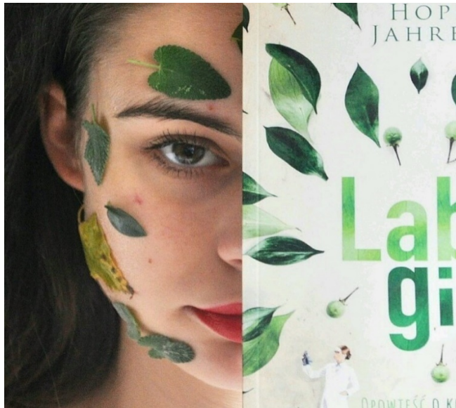
Il. 1. Post udostępniony w serwisie Instagram.

Interesujące jest jednak, że część twórców po założeniu profilu dotyczącego książek zakłada bloga – świadczy to o potrzebie wypowiedzenia się o książkach w sposób bardziej rozbudowany niż umożliwia to Instagram.