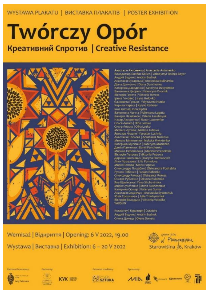
Рис. 3. Pierwsza strona Katalogu wystawy „Twórczy opór”

Wystawę „Twórczy opór” można oglądać do 20 maja br. w Galerii Sztuki „W Przyziemiu” w Krakowie.