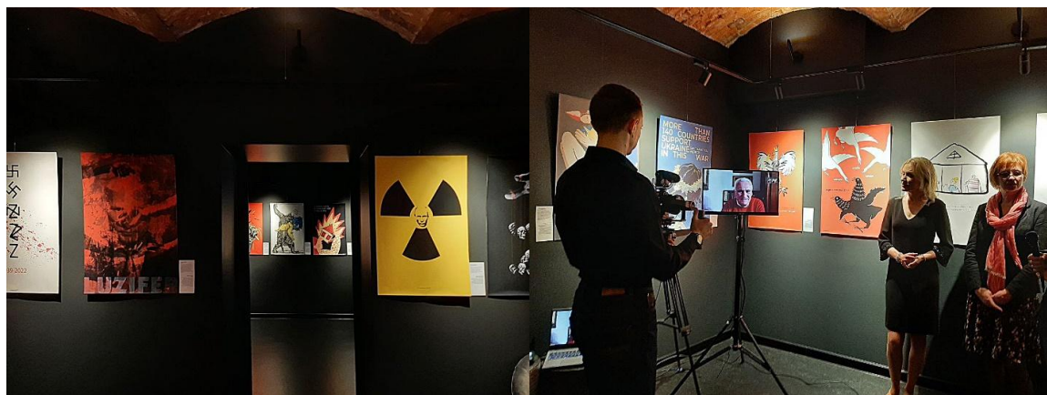
Fot. 1. Ekspozycja wystawy „Twórczy opór” w Galerii Sztuki „W Przyziemiu”

W dniu 6 maja 2022 r. w krakowskiej Galerii Sztuki „W Przyziemiu” odbył się wernisaż wystawy plakatów pt. „Twórczy Opór”. Na wystawie zaprezentowano plakaty – stworzone przez ukraińskich artystów w pierwszych tygodniach wojny. „Twórczy Opór” jest artystyczną inicjatywą studentów wydziałów graficznych dwóch kijowskich uczelni – Kijowskiego Narodowego Uniwersytetu Kultury i Sztuki oraz Kijowskiego Uniwersytetu Kultury. To właśnie wykładowcy i studenci wydziałów grafiki już drugiego dnia wojny uruchomili projekt wyrażający tragedię inwazji na Ukrainę.