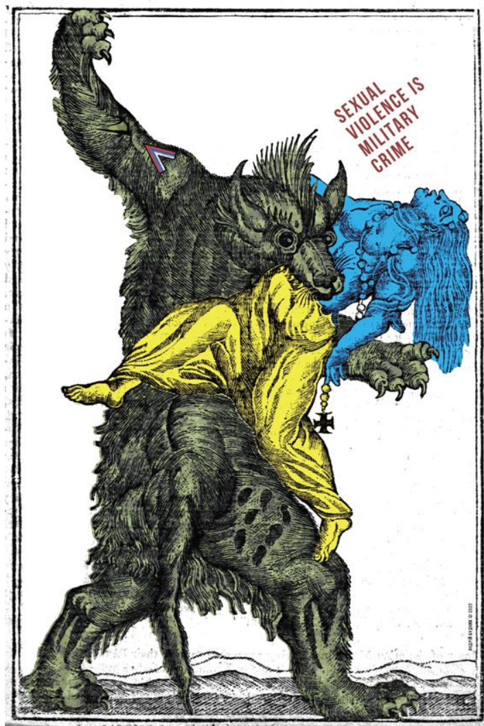
Ryc. 2. Andriy Budnyk – plakat na wystawie

dramatyczne. Są w nich odniesienia i aluzje, które często nie wymagają słów. Mówią o Ukrainie w języku ukraińskiego ornamentu, w języku symbolicznych kolorów żółtego i niebieskiego, w języku kultowych dla Ukrainy utworów Tarasa Szewczenki, Łesi Ukrainki, Iwana Franki. O wrogu mówi wstążka św. Jerzego i litera „Z”, która już zmieniła się z litery w haniebny znak rosyjskich okupantów. O wrogu mówi też cytat ze starej niemieckiej ryciny z potwornym wilkołakiem. Wojna zaburza umysły, wynosząc demony na powierzchnię.