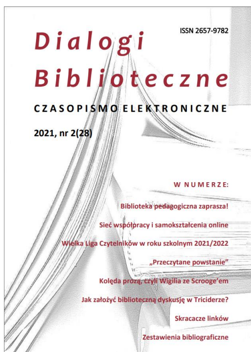
Il. 2. „Dialogi Biblioteczne” 2021, nr 2(28)

Warto podkreślić, że półrocznik katowickiej PBW doczekał się już opracowań naukowych, w których dokonano jego szczegółowej analizy 4 . Wszystkie numery czasopisma można bezpłatnie pobrać ze strony internetowej placówki .