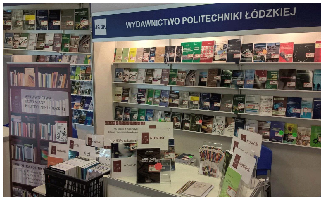
II. 3. Stoisko Wydawnictwa Politechniki Łódzkiej na Poznańskich Targach Książki w 2018 r.

Działaniem, którego nie sposób pominąć, jest uczestnictwo w ogólnopolskich targach książek – choć ze względu na pandemię nie było to w ostatnim czasie możliwe. Niemniej tego typu wydarzenia dają możliwość wymiany doświadczeń z wydawnictwami innych uczelni oraz reprezentowania Politechniki Łódzkiej na arenie krajowej i międzynarodowej.