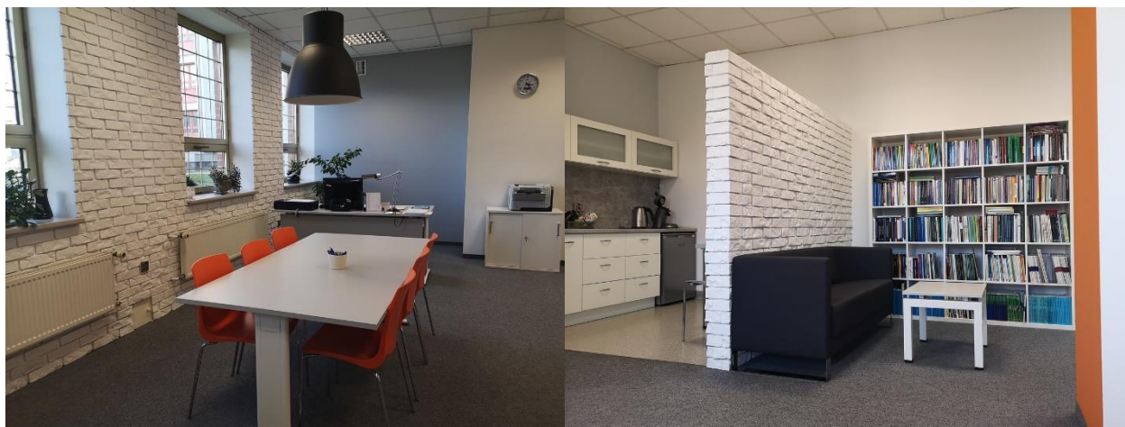
Il. 1. Pomieszczenia biurowe Wydawnictwa Politechniki Łódzkiej