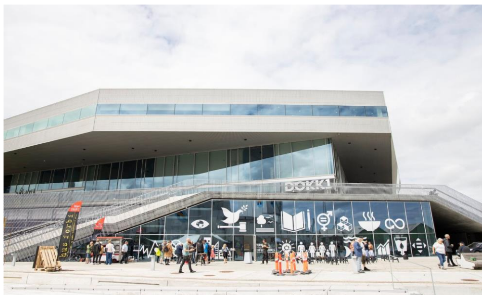
Il. 5. DOKK1, Aarhus Harbour Front