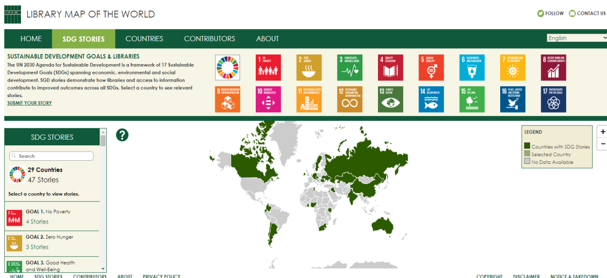
Il. 1. Biblioteczna mapa świata IFLA Library Map of the World

Warto także przyjrzeć się bliżej mapie bibliotek IFLA Library Map of the World , która prezentuje nie tylko biblioteczny świat w liczbach, ale także dobre praktyki realizacji celów. W zakładce SDG Stories można odnaleźć 47 artykułów z 29 krajów oraz przesłać własną historię.