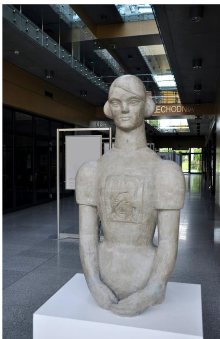
Fot. 3. David Bowie Fanka

Stała prezentacja rzeźb w instytucji publicznej podnosi jej prestiż oraz jakość estetyczną miejsca. Miejska Biblioteka Publiczna GALERIA KSIĄŻKI w Oświęcimiu potwierdziła swój status miejsca łączącego różne rodzaje sztuki oraz światopoglądów – status miejsca dialogu.