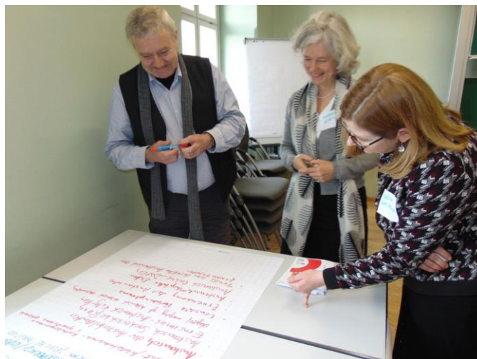
Fot. 1. Kongres Polskoznawców – Halle/Saale 2020 – Forum dla Bibliotekarzy – brainstorming

Następnego dnia udało się zorganizować jeszcze odrębną sekcję naukową, tym razem skierowaną do wszystkich zainteresowanych uczestników kongresu, pod tytułem „Library Infrastructures for Poland Research”. Odbyła się ona w języku angielskim i pozwoliła na ogólne zaprezentowanie narzędzi wyszukiwania naukowego i serwisów bibliotek w zakresie szeroko pojętych badań nad Polską, prowadzonych zarówno w Niemczech, jak i w Polsce, oraz dostępnością tego typu źródeł.