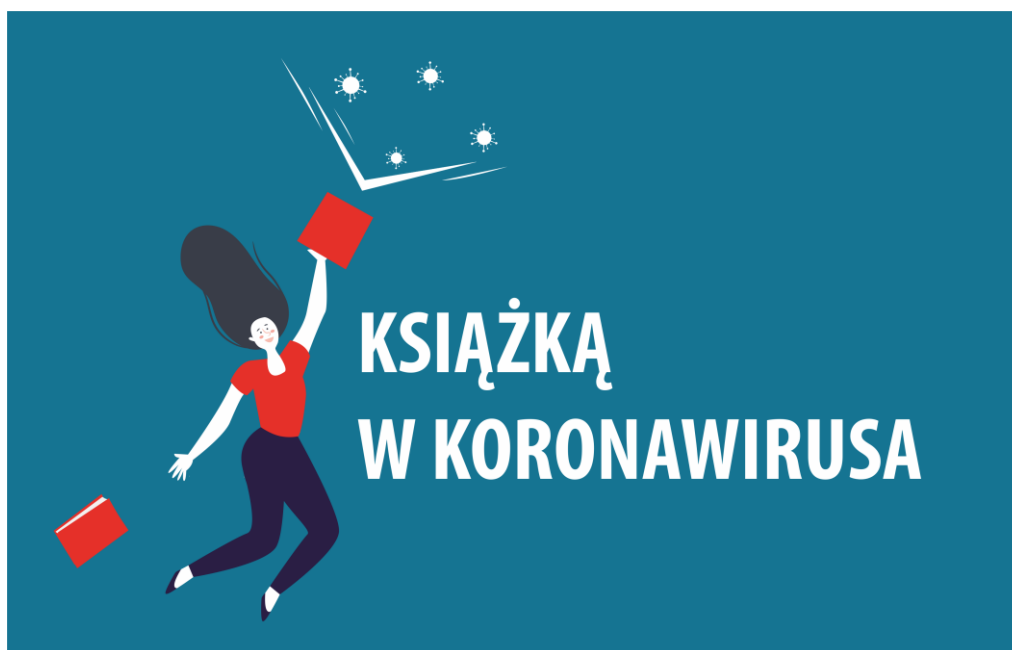
Rys. Grafika ilustrująca niniejszy tekst

Słowa kluczowe: biblioteki publiczne, praca zdalna, działania w sieci, biblioteka na Woli, bibliotekarze, pandemia, COVID-19