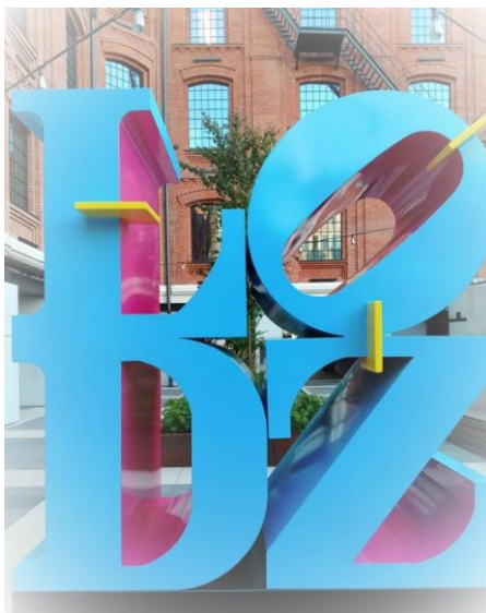
Il. 2. Łódź dla dociekliwych Fot. Mariola Soboń.

Na bibliotecznym Facebooku triumf święciły cykle tematyczne: Bibliotekarze-nauczycielom, Zaplanuj królewskie e-zajęcia, 100 lat Województwa Łódzkiego, Łódź dla dociekliwych, Film na Weekend, Filmy, które każdy nauczyciel obejrzeć powinien, czy Książka Tygodnia.