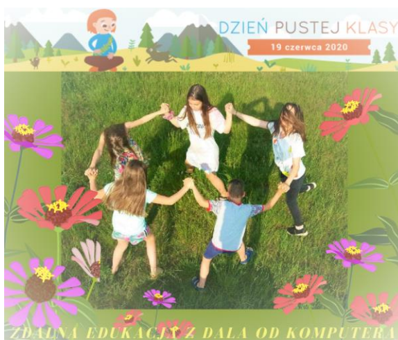
Il. 3. Dzień Pustej Klasy

W sumie od dnia rozpoczęcia obowiązkowego nauczania zdalnego do końca roku szkolnego opublikowano 128 postów. Na Facebooku upowszechniano kulturę czytelnictwa, m.in. poprzez popularyzowanie zbiorów cyfrowych bibliotek (np. National Emergency Library: Internet Archive), przypomnienie o istotnych świętach ( Dzień Książki dla Dzieci, Dzień Pustej Klasy ), popularyzowanie ciekawej literatury (np. Ciekawe książki na temat ogrodu w Pedagogicznej Bibliotece Wojewódzkiej w Łodzi połączone z publikacją quizu sprawdzającego dotychczasową wiedzę czytelnika w tym zakresie) czy informowanie o stanie czytelnictwa w Polsce w 2019 r. (na podstawie raportu Biblioteki Narodowej).