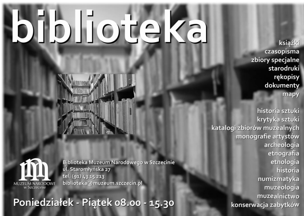
Il. 1. Plakat BMNS z 2012 r. Aut. Daniel Źródlewski.

muzeum „Materiały Zachodniopomorskie” (sprawozdania za lata 1956–2000, tomy MZP 2–46). Podobnie wyglądała specjalistyczna informacja o kolekcji starych druków BMNS. Kolekcja nie funkcjonowała w świadomości środowiska lokalnego, o czym świadczył brak wzmianek o zbiorze w opracowaniach rejestrujących zasoby starych druków w Szczecinie 1 . Wśród osób dotąd „wtajemniczonych” w istnienie biblioteki, oprócz muzealników i środowisk ściśle powiązanych z muzeum, byli studenci Katedry Archeologii Instytutu Historii i Stosunków Międzynarodowych Uniwersytetu Szczecińskiego (od 2005 r.), dla których biblioteka muzealna stanowiła, i nadal stanowi, jedyną dostępną na miejscu i bogate zaplecze biblioteczne (wynik umowy podpisanej pomiędzy US a MNS z 2007 r. zobowiązującej BMNS do ułatwienia studentom z korzystania ze swoich zbiorów oraz uwzględniania ich potrzeb przy gromadzeniu publikacji) 2 .