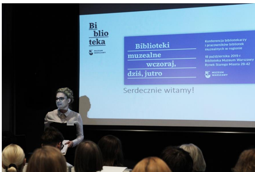
Il. 3. Panel główny ogólnopolskiej konferencji w Muzeum Warszawy

Od połowy maja 2020 r. aktywnie działa na Facebooku grupa „ BUM Bibliotek Muzealnych ”. Jest to pierwszy krok do stworzenia wspólnej platformy do dyskusji nad sprawami środowiska, wymiany dobrych praktyk, a przede wszystkim nawiązania kontaktów i „przyjaźni międzybibliotecznych”.