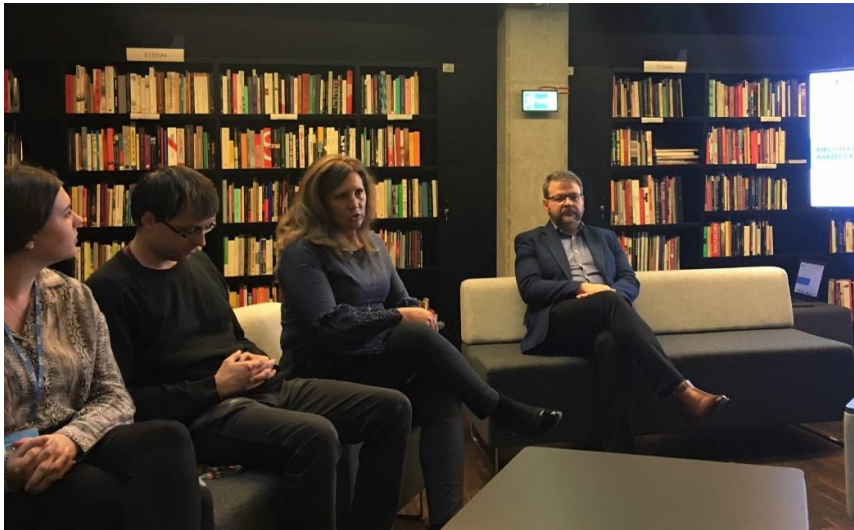
II. 2. Spotkanie robocze w czytelni Biblioteki ECS w Gdańsku

Z kolejną inicjatywą wystąpiła Biblioteka Europejskiego Centrum Solidarności w Gdańsku, organizując 4 grudnia 2019 r. robocze Spotkanie bibliotek muzealnych województwa pomorskiego .