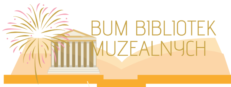
Il. 4. Logo grupy „BUM Bibliotek Muzealnych”

Od połowy maja 2020 r. aktywnie działa na Facebooku grupa „ BUM Bibliotek Muzealnych ”. Jest to pierwszy krok do stworzenia wspólnej platformy do dyskusji nad sprawami środowiska, wymiany dobrych praktyk, a przede wszystkim nawiązania kontaktów i „przyjaźni międzybibliotecznych”.