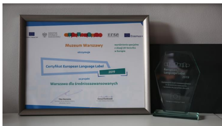
Il. 5. Statuetka i dyplom European Language Label 2019

Zajęcia przygotowywane są w porozumieniu z lektorami grup. Omawiana jest dynamika grupy, ustalany jej poziom językowy, narodowość, wiek i zainteresowania uczestników, materiał leksykalny i gramatyczny, który już znają, zakres zagadnień, z którym zapoznają się w bibliotece i muzeum. Dzięki tej wiedzy powstają w pełni spersonalizowane i niepowtarzalne zajęcia edukacyjne, dostosowane do potrzeb i oczekiwań ich uczestników.