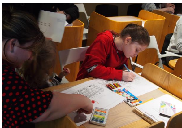
Il. 6. Zajęcia dla dzieci i młodzieży w ramach projektu „Warszawa dla początkujących”

Projekt wraz z książką zostały wyróżnione prestiżową nagrodą Komisji Europejskiej European Language Label 2019 za jakość i innowacyjność w nauczaniu języków obcych.