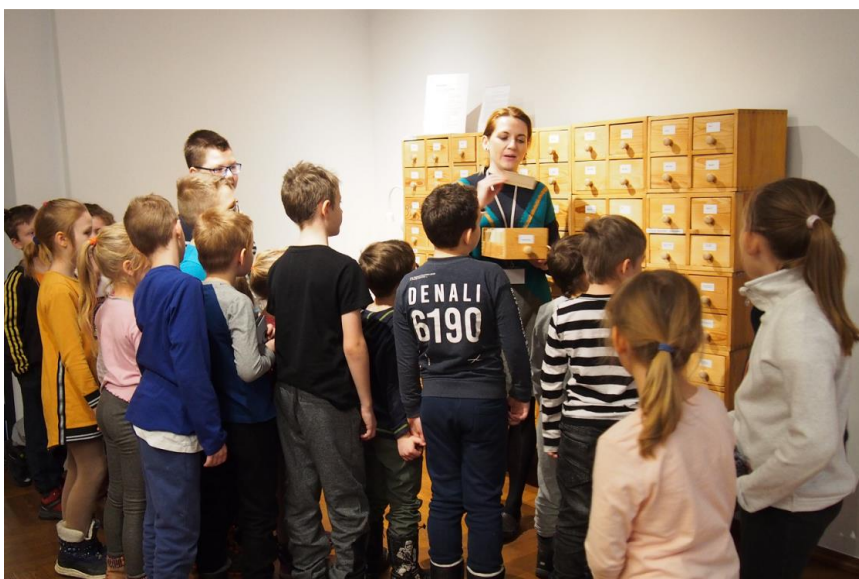
Il. 8. Lekcja biblioteczna „Spotkania z książką” – w magazynach Biblioteki Muzeum Warszawy

Ważną częścią prezentowanych wcześniej zajęć bibliotecznych jest zwiedzanie biblioteki, demonstracja sposobów korzystania ze zbiorów i innych źródeł informacji. Często również towarzyszy temu wizyta w magazynach i przestrzeniach na co dzień niedostępnych czytelnikom. Dzięki tym aktywnościom uczestnicy lekcji dowiadują się, jak w praktyce wygląda zamawianie książek oraz specyfika pracy bibliotekarzy.