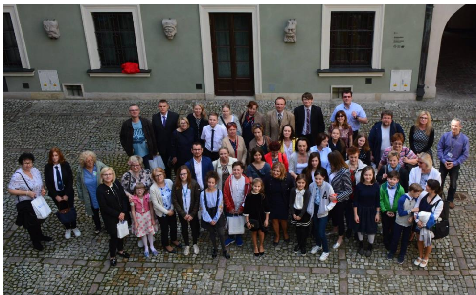
Il. 8. Wspólne zdjęcie laureatów III edycji Konkursu Literackiego Muzeum Warszawy

Biblioteka zachęcała do udziału na stronie internetowej Muzeum Warszawy oraz Facebooku. Nawiązała współpracę z „Kroniką Warszawy”, w której od 2019 r. publikowane są fragmenty zwycięskich utworów. Uczniowie pisali już legendy (2016), wiersze (2017, 2019), opowiadania (2018). Właśnie odbywa się piąta edycja konkursu pt. „Opowiem Ci o Warszawie”, w ramach której uczestnicy tworzą felietony. Ta edycja jest wyjątkowa, gdyż w pełni wirtualna, przypadła bowiem na okres, gdy z powodu pandemii COVID-19, uczestnicy konkursu oraz nauczyciele uczą się i pracują zdalnie.