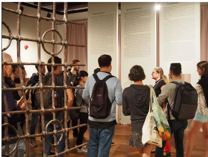
Il. 3. Lekcja przedmiotowo-językowa prowadzona przez bibliotekarza z wykorzystaniem wystawy czasowej Muzeum Warszawy „Spółdzielnia ORNO. Biżuteria”

Głównym wyróżnikiem lekcji prowadzonych metodą przedmiotowo-językową oraz językowych gier muzealnych i miejskich realizowanych w ramach projektu jest przeprowadzanie poszczególnych aktywności na stałych i tymczasowych wystawach, na Rynku Starego Miasta oraz kojarzenie tekstów literackich i źródłowych z eksponatami na nich prezentowanymi.