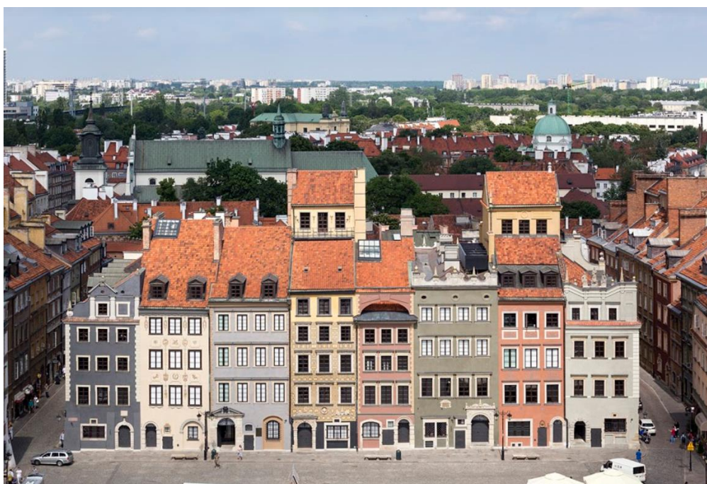
Il. 1. Siedziba Muzeum Warszawy

Czy biblioteka jest w stanie sprostać temu trudnemu zadaniu? Autorki postarają się odpowiedzieć na powyższe pytanie, korzystając z przykładu oferty edukacyjnej Biblioteki Muzeum Warszawy.