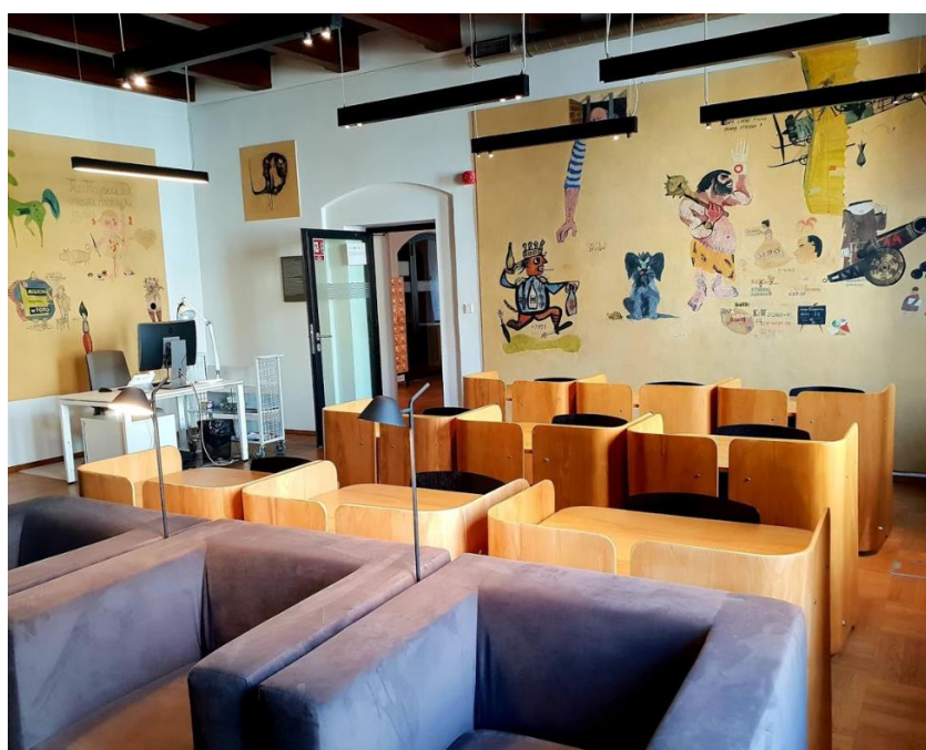
Il. 2. Czytelnia biblioteki z malowidłami na ścianach przeniesionymi z Wydawnictwa „Iskry”

Powyższy cytat bardzo dobrze odzwierciedla drogę od klasycznej edukacji prowadzonej w bibliotekach i/lub muzeach do edukacji oferowanej przez biblioteki muzealne. Dzięki funkcjonowaniu na pograniczu między biblioteką a muzeum, biblioteki muzealne z jednej strony mogą czerpać najlepsze i najatrakcyjniejsze praktyki, stosowane w obydwu typach instytucji, z drugiej muszą mierzyć się z problemami, których nie mają ani samodzielne biblioteki, ani muzea.