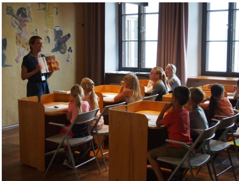
Il. 7. Lekcja biblioteczna „Freski, kreski, humoreski”

W 2020 r. oferta została poszerzona o lekcje wyjazdowe („Witaj Warszawo!”), w ramach których bibliotekarze planują odwiedzać szkoły oraz biblioteki i na miejscu prowadzić biblioteczno-warszawianistyczne warsztaty, obecna sytuacja może jednak na to nie pozwolić. Dlatego też rozpoczęto przygotowania do lekcji bibliotecznych online.