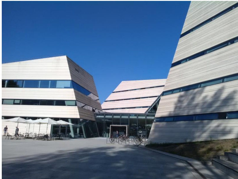
Il. 3. Centrum Komunikacji i Informacji Naukowej

Z racji wspomnianego limitu czasu z szerokiej oferty miejsc do odwiedzenia wybrano również: Oddział Książek Rzadkich, Oddział Manuskryptów, Oddział Ochrony Dziedzictwa Dokumentalnego oraz Muzeum Adama Mickiewicza.