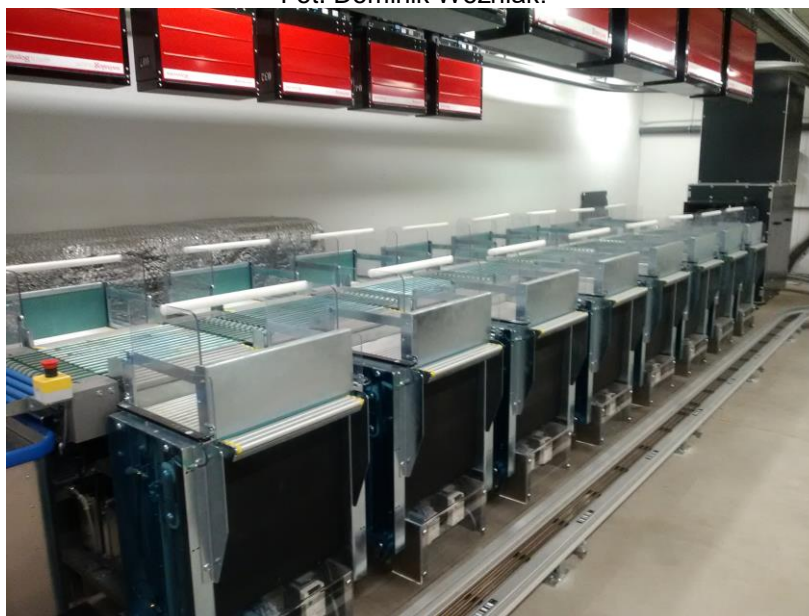
Il. 4. Pomieszczenie z urządzeniami do transportu zbiorów. Centrum Komunikacji i Informacji Naukowej