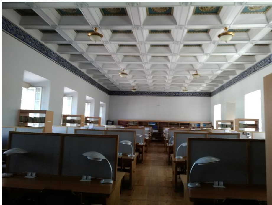
II. 2. Czytelnia Profesorska. Biblioteka Centralna

Na zapoznanie się z Centrum Komunikacji i Informacji Naukowej przeznaczony był jeden dzień. Centrum, powstałe w 2013 r., to kompleks trzech budynków będących jednocześnie biblioteką i ośrodkiem informacji, dostępnym dla wszystkich mieszkańców kraju. Otwarto je po wielu latach starań o nowy budynek biblioteki. Gmach zlokalizowany jest o około pół godziny jazdy środkami komunikacji publicznej od centrum miasta. Otoczenie kompleksu stanowi gęsty, aromatyczny las iglasty, w pobliżu którego użytkownicy bardzo chętnie spędzają przerwy w pracy i nauce. Jeden z budynków przeznaczony jest dla personelu administracyjnego i bibliotecznego oraz do celów niezwiązanych bezpośrednio z obsługą czytelników.