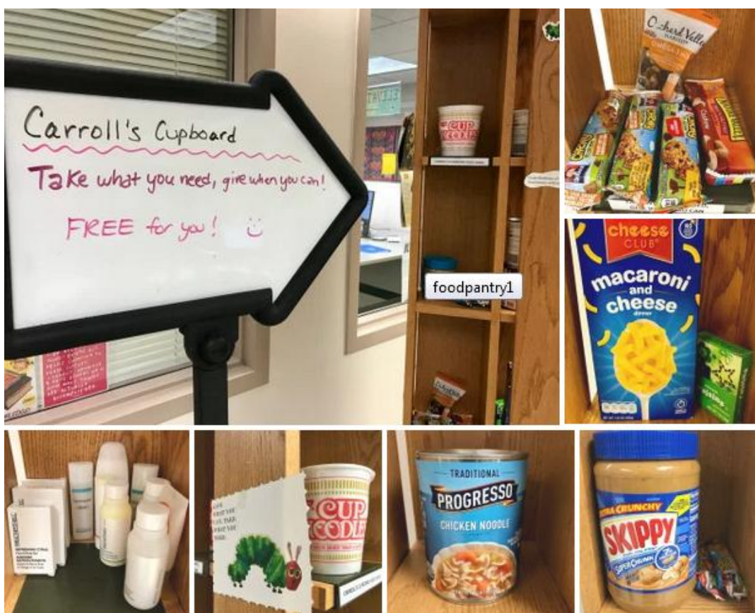
II. 2. Spiżarnia biblioteki Carrol University w Waukasha

Poza produktami żywnościowymi spiżarnia została wzbogacona o inne rzeczy ważne w codzienności nie tylko akademickiej. Na półce można znaleźć pasty do zębów, szczoteczki, mydła, notatniki, detergenty do prania. Budujące jest to, że nie tylko ubywa produktów z wieży, ale są one na bieżąco uzupełniane, a użytkownicy biblioteki chwalą duże wsparcie, jakie od niej otrzymują 4 .