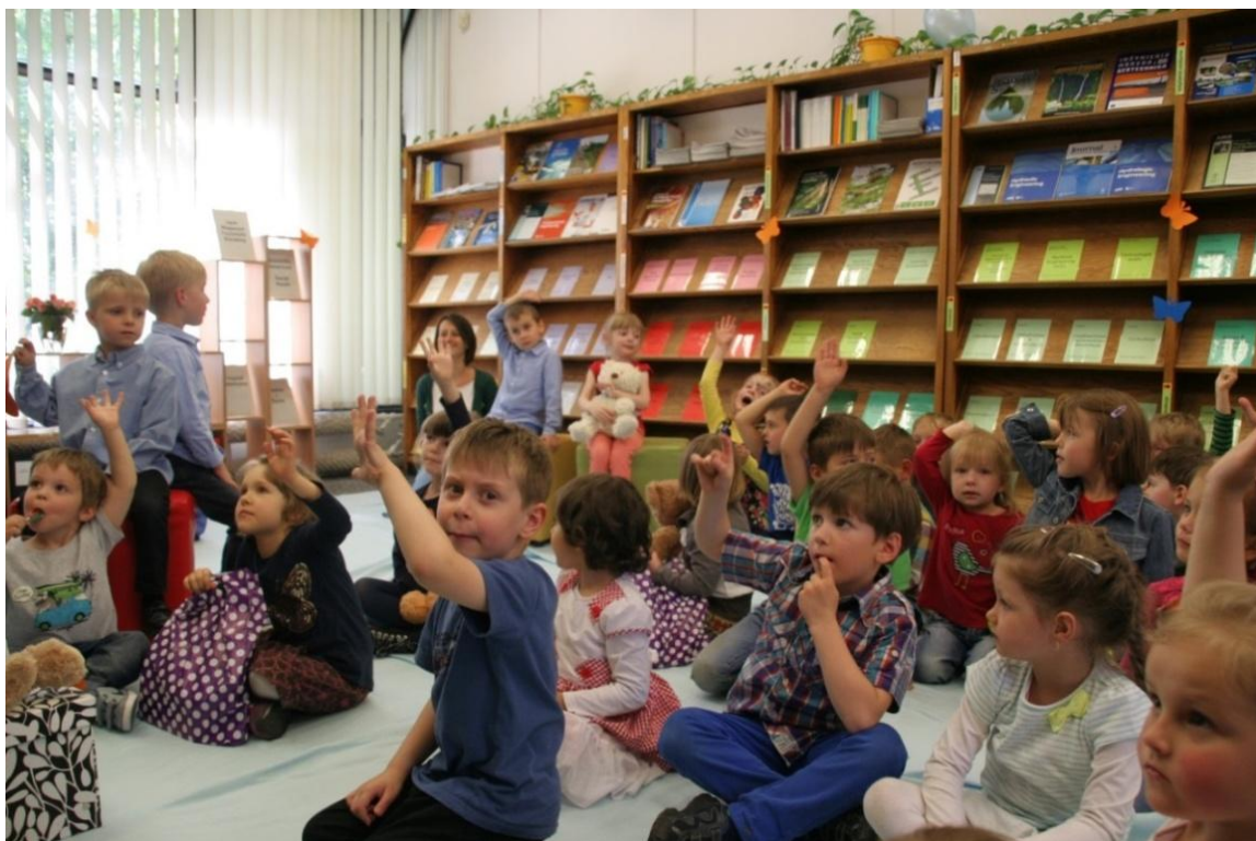
II. 3. Warsztat biblioterapeutyczny pt. „Ogród pięknych słów”

Na Politechnice Krakowskiej biblioterapia jest obecnie skierowana do najmłodszych. Rozważa się poszerzenie grupy odbiorców o seniorów skupionych przy uczelni w ramach Uniwersytetu Trzeciego Wieku.