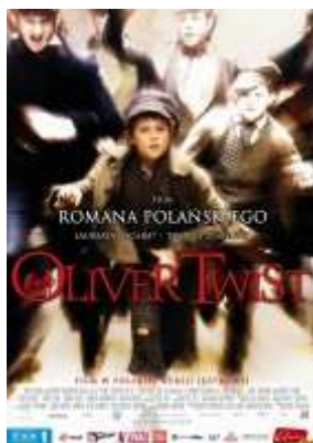
Rys. 10. Oliver Twist — plakat.