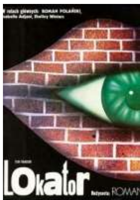
Rys. 9. Lokator — plakat.

zmienić w dziewczynę — egiptolożkę, która mieszkała w tym mieszkaniu przed nim. Okazało się, że dziewczyna umarła na skutek obrażeń poniesionych w próbie samobójczej. Trelkovsky — grany przez R. Polańskiego — zaczął sądzić, że sąsiedzi z kamienicy mają coś wspólnego ze śmiercią dziewczyny. Sytuacja pogorszyła się, gdy emigrant zaczął posądzać tych samych sąsiadów o to, że czyhają też na jego życie. U przyjaciół samobójczynie widział książkę, dotyczącą Egiptu, która kiedyś została pożyczona jednemu z nich. Trelkovsky poprosił również o jej pożyczanie. Nie przeczytał jej jednak, nie przeglądał. Książka to jeden z nielicznych sygnałów o profesji i zainteresowaniach nieżyjącej już kobiety, której los zdawał się podzielić chłopak.