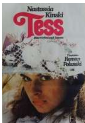
Rys. 6. Tess — plakat.

Kolejne obrazy, w których książki dookreślają bohaterów to: Pianista , Lokator , Tess i Nóż w wodzie . Podobnie jak w Rzezi , gdzie biblioteka była głównym elementem dekoracyjnym salonu, podkreślającym wykształcenie i erudycję właścicieli, tak w Tess widzimy ojca-pastora, siedzącego za biblioteką, a na stołach i szafkach w jego gabinecie leży książki, świadczące o wszechstronnym do nich zamiłowaniu i potrzebie przebywania z pismem, dziełami i drukiem. Natomiast Tess, podczas modlitwy na stole trzymała modlitewnik, który był jakby niemyim świadkiem jej modlitwy, wsparciem, co podkreślają złożone na nim ręce.