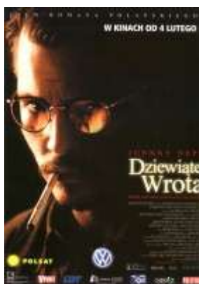
Rys. 2. Dziewięć wrot — plakat.

Książkę jako klucz, jako dzieło pożądane, za które warto umierać i zabijać pokazał R. Polański także w Dziewiętych wrotach . Film produkcji francusko-amerykańsko-hiszpańskiej wyreżyserował w 1999 r. Scenariusz obrazu został oparty na powieści Arturo Pérez-Reverte'a Klub Dumas . Główną rolę — antykwariusza, bibliofila Deana Corso zagrał Johnny Depp. Corso specjalizował się w odnajdywaniu zaginionych dzieł, pierwodruków i białych kruków. Robił to dla majątnych kolekcjonerów-bibliofilów. Cel, dla niego, uświęcał każdą metodę. Książki zdobywał oszukując i prowadząc nieetyczne gry. W ten sposób odnalazł na przykład rzadkie, czterotomowe wydanie Don Kichota . Od wydawcy — Borisa Balkana — gromadzącego w swojej bibliotece dzieła związane z diabłem, otrzymał zadanie odnalezienia trzech zachowanych na świecie, pozostałych egzemplarzy, niedawno zakupionej książki. Antykwariusz miał porównać ich autentyczność. Autorem rzeczonyj publikacji był weneccjanin — Aristide Torchi, który napisał ją w roku 1666, na podstawie dzieła stworzonego przez samego diabła. Za ten czyn autor, wyrokiem Świętej Inkwizycji, spłonął na stosie. Balkan nabył ją od Andrew Telfera, który dzień po transakcji popełnił samobójstwo. Księga Dziewięć wrót Królestwa Cieni ilustrowana była dziewięcioma rycinami, które poprawnie zinterpretowane i ułożone miały przywołać diabła i otworzyć wrota do piekła. Książka to brama, klucz do innego wymiaru, do piekła.