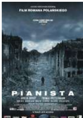
Rys. 7. Pianista — plakat.