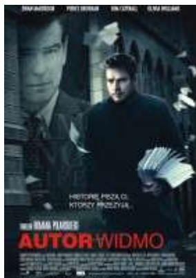
Rys.1. Autor widmo — plakat.

Kodeksy w filmach R. Polańskiego miały moc niezwykłą — mogły zmieniać rzeczywistość. Bywały także elementem niebezpiecznym, prowadzącym bohaterów do prawdy, zagrażającej ich życiu. Tak było na przykład w obrazie Autor widmo , którego jeden z bohaterów, umarł w tajemniczych okolicznościach (przed rozpoczęciem akcji filmu), kończąc pisanie biografii ( Ta książka go zabiła ). Kontynuacji tego zadania — napisania śmiertelnie niebezpiecznej książki — podjął się nowy ghostwriter ( autor widmo ). O tym, że będzie to zobowiązanie niebezpieczne i ciekawe przekonał się szybko.