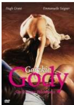
Rys. 12. Gorzkie gody — plakat.

Inną produkcją R. Polańskiego, mówiącą tym razem o prawdziwym pisarzu, a raczej o kimś, kto chciałby nim być były Gorzkie gody . Obraz ten to ekranizacja powieści Pascala Brucknera. Opowiadał historię małżeństwa, które wybrało się w swoją rocznicową podróż statkiem i w czasie rejsu spotkało Amerykanina, marzącego o tym, aby zostać pisarzem. Jego męki twórcze trwały już osiem lat. Wysyłał swoje powieści do różnych wydawców, nikt jednak nie zdecydował się wydać jego prozy. W poszukiwaniu muzy wybrał się nawet do Paryża — miasta wielkich prozaików przepastnych fabuł i kultu powieści. Bohater był w trakcie pracy nad kolejną książką, opisującą romanse. Jego partnerka, Francuzka, była zaniepokojona treścią książki. Autor uspokoił ją, zapewniając, że to wyłącznie fikcja literacka, a on jest jej wierny. Film poruszył też problem rynku księgarskiego. Wydawca, z którym rozmawiał Oscar, przekonywał go, że Paryż to pisarskie mauzoleum, a podmiot literackich powinien szukać w Stanach Zjednoczonych. Tworzyło się swoiste błędne koło: wydawcy nie chcieli publikować powieści debutantów, bo to nie gwarantowało im zysku. Oscar nie chciał pogodzić się z tym, że nie mógł publikować swoich dzieł.