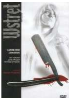
Rys. 13. Wstręt — plakat

coraz głębsze stadia obłędu, używała książki do starcia krwi zamordowanego chłopaka.