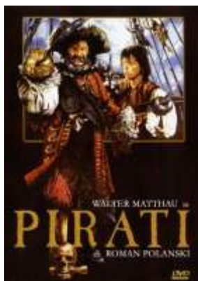
Rys. 14. Piraci — plakat.

Trochę inne użycie książki widzieliśmy w Piratach , gdzie była ona tylko księgą rachunkową świadcząca o zobowiązaniach, jakie ma paser względem kapitana Reda. Książka była tu jedynie rekwizytem, przedmiotem, z którego korzystają bohaterowie w określonej sytuacji.