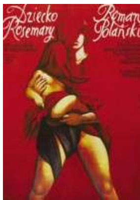
Rys. 3. Dziecko Rosemary — plakat.

Parodią horrorów i filmem odbiegającym w klimacie od poprzednich byli wyreżyserowani przez R. Polańskiego Nieustraszeni pogromcy wampirów . Tytułowi bohaterowie to mistrz i uczeń — profesor i jego asystent, którego gra sam reżyser. Starają się oni udowodnić istnienie wampirów. Uczony wielokrotnie powoływał się w tej kwestii na autorytet księgi Elibori, w której przeczytał wiele podstawowych i interesujących informacji o wampirach, ich zwyczajach oraz metodach walki z nimi. Ponadto mistrz zwiedzał niezwykłą bibliotekę, hrabiego Counta Von Krolocka — dostojnego wampira, mieszkającego w pobliskim zamku. Biblioteka została połączona razem z obserwatorium astronomicznym. Kolekcja książek wzbudziła w profesora zachwyt. Pieczołowicie przyglądał się oprawionym w skórę wolumenom. Tak zgromadzona biblioteka była dowodem na zainteresowanie wampira naukami przyrodniczymi. Znał on nawet książkę o nietoperzach, napisaną przez profesora Abronsiusa i poprosił go o dedykację na posiadanym egzemplarzu. W rozmowie z hrabią uczony wspominał, że właśnie przygotowuje drugi tom publikacji, który będzie uwzględniał opis nietoperzy, latających zimą.