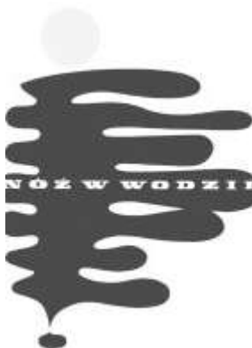
Rys. 8. Nóż w wodzie — plakat.

Wśród kolejnych bohaterów R. Polańskiego, którzy zostali dookreśleni przez swoje lektury znalazł się młody chłopak, postać z Noża w wodzie , który podróżując autostopem, woził ze sobą książkę, określającą jego styl życia. Podczas jednej z takich podróży w towarzystwie pewnego małżeństwa wywiązała się szamotanina, w konsekwencji której chłopak wpadł do wody, a ponieważ wcześniej przyznał się, że nie umie pływać, myśleli, że utonął. Małżeństwo chciało zatrzeć ślady jego pobytu na łódce, wyrzucając jego rzeczy. Wtedy z plecaka wypadła książka pt. Autostop . Stało się to jakby symbolicznym końcem podróży, zamknięciem pewnego etapu, ale tylko pozornie. Chłopak przeżył i kontynuował swoją przygodę, pozostając wierny swojemu stylowi życia.