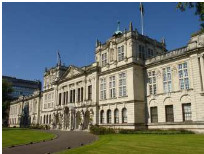
Fot. 1. Uniwersytet w Cardiff

Jestem bibliotekarką z długim stażem zawodowym. Pracuję w Oddziale Informacji Naukowej Biblioteki Szkoły Głównej Handlowej, od niedawna na kierowniczym stanowisku. Trzy lata temu na łamach „Biuletynu EBIB” relacjonowałam swój pobyt w Bibliotece Uniwersytetu w Cardiff, stolicy Walii, gdzie razem z sześcioma osobami z krajów UE brałam udział w specjalnym programie dla pracowników bibliotek 1 . Był to czterodniowy mityng naukowy, podczas którego odbywały się wykłady, szkolenia i warsztaty dotyczące systemu bibliotekarskiego Wielkiej Brytanii, spotkanie, rzecz można, inauguracyjne. Przez te lata program na stałe wszedł do harmonogramu zajęć tutejszych bibliotekarzy. I oto w kwietniu roku 2012 znalazłam się ponownie na uniwersytecie w Cardiff, tym razem jako jedna z dwanaściorga uczestników szkolenia.