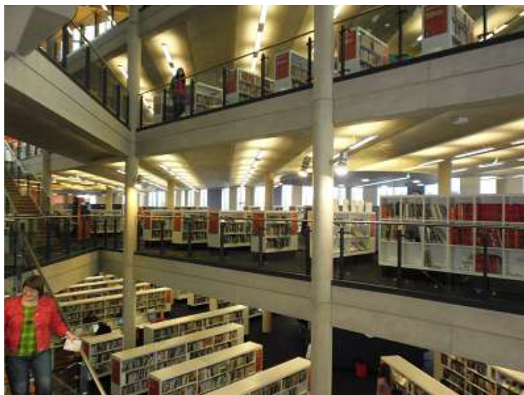
Fot. 3. Biblioteka Publiczna w Cardiff.

Biblioteka ta ma długoletnią tradycję, a w obecnym kształcie została otwarta dla użytkowników 14 marca 2009 r. Na sześciu kondygnacjach skupia się życie mieszkańców Cardiff. Są tu specjalne sale konferencyjne — z jednej z nich korzystaliśmy podczas naszej wizyty 19 kwietnia. Pierwsze piętro zajmują zbiory dziecięce, drugie — literatura piękna, wyżej dzieła z dziedziny historii sztuki i muzyki — jest tu nawet fortepian. Czwarte piętro gromadzi zbiory o charakterze naukowym. Na najwyższym piętrze mieszczą się zbiory w języku walijskim. Po lunchu poszczególni uczestnicy opowiadali o swoich miejscach pracy. Ja przedstawiłam w prezentacji, jak funkcjonuje w naszej bibliotece szkolenie on-line dla studentów pierwszego roku, rozwiązanie alternatywne dla miejscowej information literacy . Na koniec już indywidualnie zwiedziliśmy Muzeum Narodowe Walii.