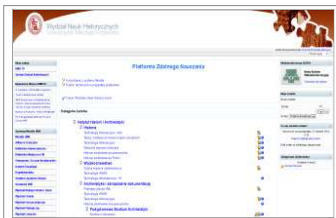
7. Platforma e-learningowa Wydziału Nauk Historycznych UMK.