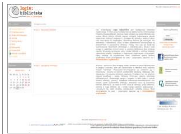
8. Serwis e-learningowy „Login: Biblioteka”.

Instytut prowadzi swoją platformę e-learningową opartą na systemie zarządzania kursami Moodle, zaś pracownicy instytutu równoległe zarządzają swoimi stronami internetowymi, na których udostępniają materiały dydaktyczne. Ponadto wraz z Biblioteką Uniwersytecką w Warszawie opracowany został kurs e-learningowy Login: Biblioteka , w którym niektórzy pracownicy są zdalnymi tutorami w ramach tzw. wirtualnych dyżurów 15 . Podstawowym celem projektu jest stworzenie i realizacja kursu e-learningowego na potrzeby bibliotekarzy.