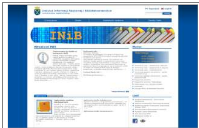
4. Oficjalna strona Instytutu Informacji Naukowej i Bibliotekoznawstwa w Krakowie.

Źródło: INiB: Instytut Informacji Naukowej i Bibliotekoznawstwa Uniwersytetu Jagiellońskiego [on-line]. [Dostęp 28.08.2012]. Dostępny w World Wide Web: http://www.inib.uj.edu.pl .