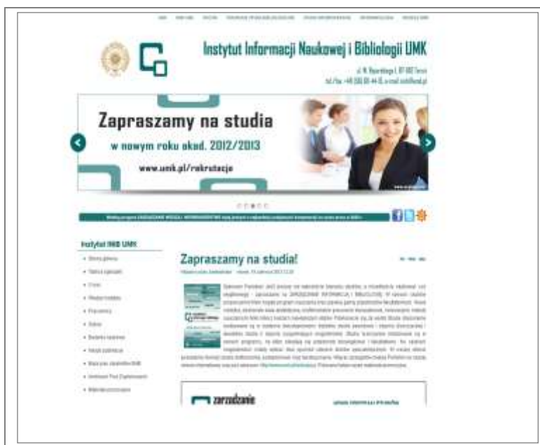
6. Oficjalna strona Instytutu Informacji Naukowej i Bibliologii UMK.

łeczne. Nowe programy kształcenia będą bardziej elastyczne i w większym stopniu dostosowane do potrzeb rynku. Pracując nad nimi, pracownicy instytutu mieli na uwadze fakt, że w ciągu kilku najbliższych lat „specjalista od informacji” będzie jednym z najbardziej poszukiwanych fachowców. Dlatego też uznano, iż należy wyposażyć studentów nie tylko w nowoczesną wiedzę, ale też w umiejętności oraz kompetencje społeczne, o które tak często upominają się pracodawcy 13 .