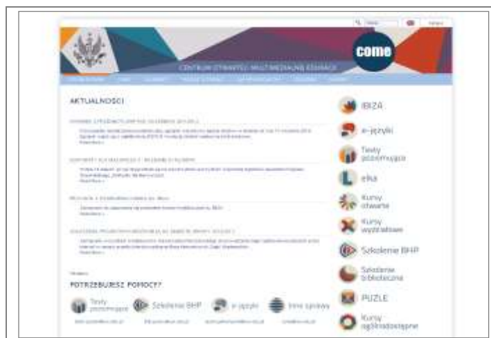
10. Centrum Otwartej i Multimedialnej Edukacji.

Źródło: COME Uniwersytet Warszawski [on-line]. [Dostęp 28.08.2012]. Dostępny w World Wide Web: http://portal.uw.edu.pl/web/come-community/strona-glowna .