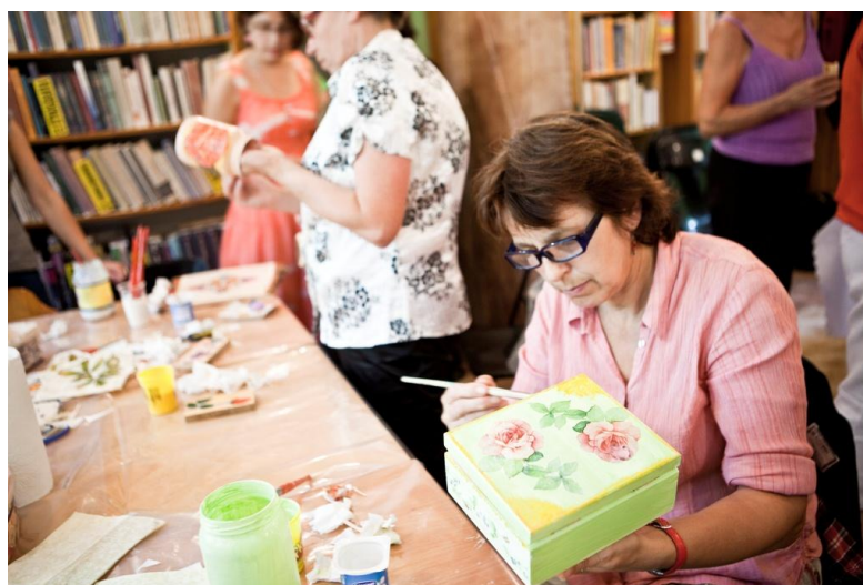
Il. 2. Biblioteka Publiczna w Krynicy-Zdroju

Ludzie starsi przynoszą do bibliotek dokumenty, listy i zdjęcia ważne dla rozwoju miejscowości i wspólnie z bibliotekarkami dokumentują lokalną historię. W bibliotekach uczą się także obsługi komputera, m.in. na kursach, które organizują biblioteki uczestniczące w PRB. Prawie 250 tys. mieszkańców małych miejscowości właśnie w bibliotece po raz pierwszy zetknęło się z nowoczesnymi technologiami.