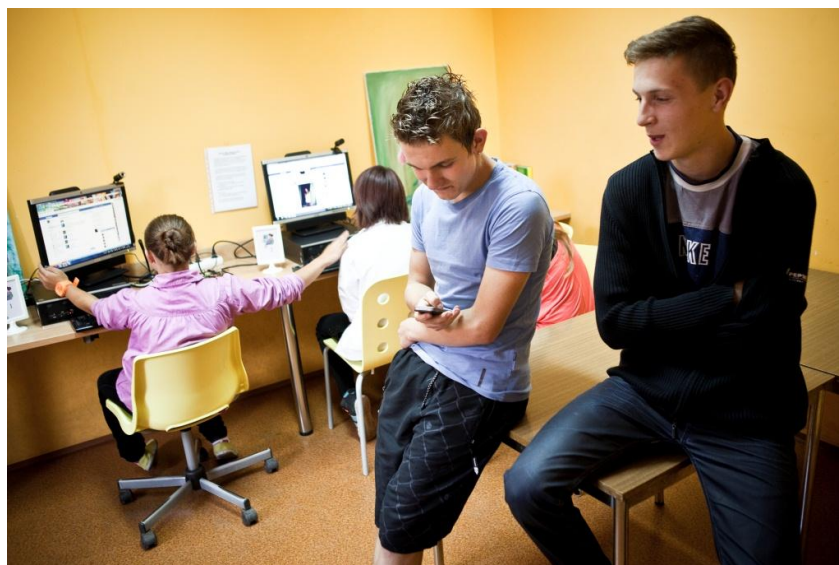
Il. 1. Biblioteka Publiczno-Szkolna w Ostroszowicach

Dla osób dorosłych biblioteka to przestrzeń, w której mogą załatwić codzienne sprawy. Przychodzą tu, żeby zapłacić przez Internet rachunki, sprawdzić rozkład jazdy autobusów, dowiedzieć się, w jakich godzinach przyjmuje lekarz. Bibliotekarz pomaga im także w poszukiwaniu pracy. Około 100 tys. mieszkańców małych miejscowości wykorzystuje komputery w bibliotekach do pisania życiorysów, listów motywacyjnych lub do kontaktowania się z pracodawcami.