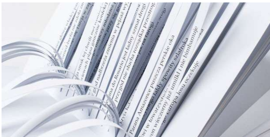
Il. 2. Raymond Queneau — Sto tysięcy miliardów wierszy