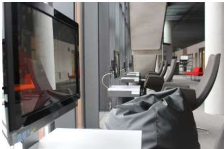
Il. 4. Arteteka