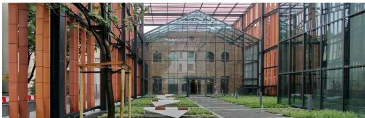
Il. 5. Małopolski Ogród Sztuki

Arteteka — nowa agenda Wojewódzkiej Biblioteki Publicznej w Krakowie — mieści się w Małopolskim Ogrodzie Sztuki (ul. Rajska 12, wejście od ulicy Szujskiego). To nowe ważne miejsce na kulturalnej mapie Krakowa, ciekawe chociażby ze względu na architekturę — kolejną realizację projektu Krzysztofa Ingardena, znanego już w Krakowie z budowli takich jak Muzeum Sztuki i Techniki Japońskiej „Manggha” czy Pawilon Wystawienniczo-Informacyjny „Wyspiański 2000” przy placu Wszystkich Świętych. Arteteka to trzy piętra zbiorów dla miłośników sztuki: zbiory tradycyjne i multimedialne, sprzęt (komputery, tablety, czytniki e-booków, zestawy PlayStation) oraz profesjonalne oprogramowanie do tworzenia i obróbki muzyki i grafiki.