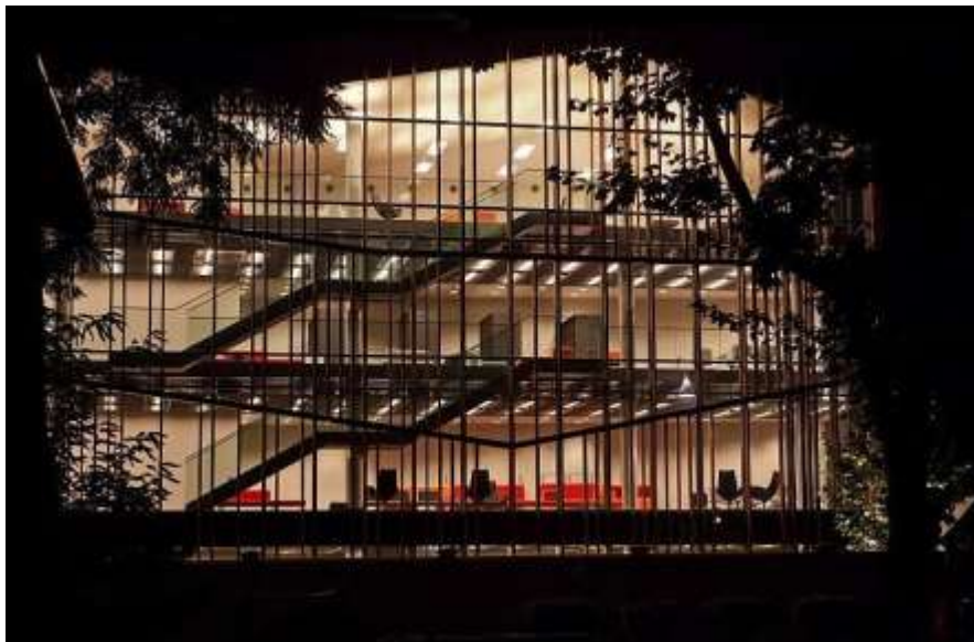
Il. 6. Małopolski Ogród Sztuki

http://www.liberatura.pl/ 6 . Znajduje się tam bogaty zasób informacji o teorii liberatury i e-liberatury: historia tego zjawiska, prezentacja twórców i dzieł, a także polecane linki, wykaz utworów liberackich oraz publikacji z lat 1999–2009, które omawiają twórczość liberacką.