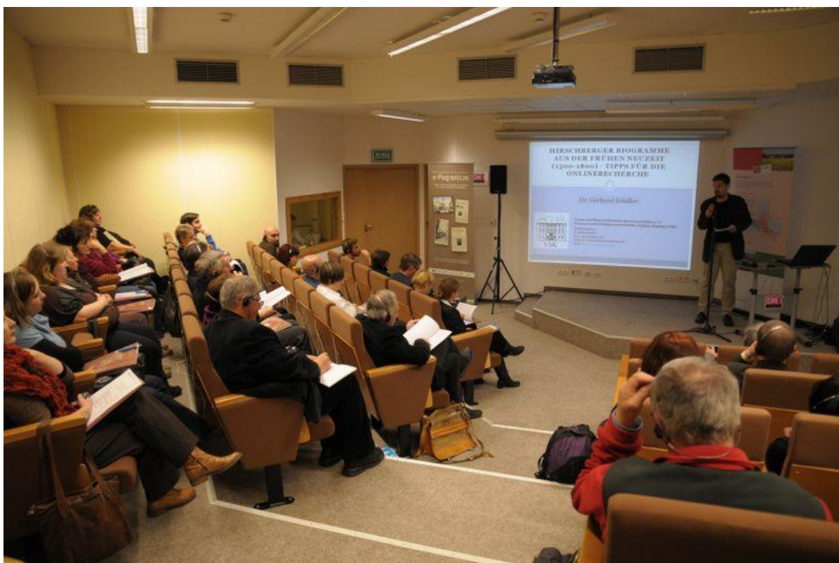
Il. 6. Konferencja inauguracyjna projektu e-Pogranicze [on-line]. [Dostęp 28.02.2013]. Dostępny w World Wide Web: http://goo.gl/s12qH .

Oprócz pożytku dla mieszkańców pogranicza, którzy stanowią grupę docelową podjętych prac, projekt przyniesie wymierne korzyści obu instytucjom, dla których zostanie zakupiony nowoczesny sprzęt i oprogramowanie niezbędne w procesie tworzenia elektronicznych bibliotek. Ponadto partner niemiecki ma możliwość stworzenia własnego zespołu do digitalizacji zbiorów na bazie doświadczeń Książnicy Karkonoskiej. Realizacja projektu przewidziana jest na lata 2012–2014. W grudniu 2012 r. w Książnicy Karkonoskiej odbyła się konferencja inauguracyjna. Zaproszeni prelegenci wprowadzili słuchaczy w trudną i skomplikowaną historię polsko-niemieckiego pogranicza, w problematykę digitalizacji zbiorów historycznych, a przede wszystkim w założenia projektu i podjęte działania partnerskie.