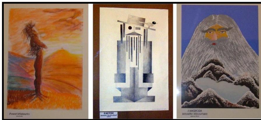
Il. 1. Wystawa prac z IV konkursu plastycznego „Karkonoš – Růbezahl – Rzepiór: Duch Karkonoszy” pod patronatem Euroregionu Nysa. [on-line]. 2005 [Dostęp 28.02.2013]. Dostępny w World Wide Web: http://biblioteka.jelenia-gora.pl/index.php?op=4&go=3 .

Od tamtej pory wiele się wydarzyło. Ogłoszony został Międzynarodowy Konkurs Plastyczny „Krakonoš — Růbezahl — Rzepiór: Duch Karkonoszy”, a jego kolejne edycje cieszą się coraz większą popularnością.