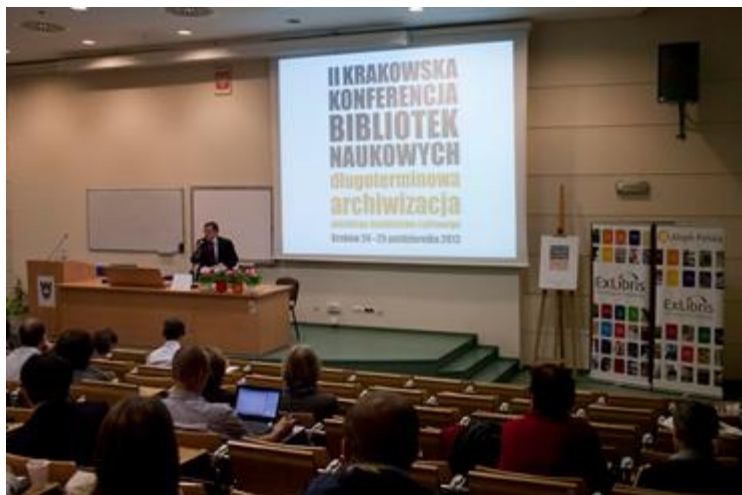
Il. 6. II Krakowska Konferencja Bibliotek Naukowych

W roku 2012 opracowano i złożono wnioski do MNiSW o dofinansowanie projektu „Repozytorium dorobku naukowego Krakowskiej Akademii im. Andrzeja Frycza Modrzewskiego”. Projekt ma na celu stworzenie systemu repozytoryjnego dokumentującego dorobek pracowników naukowo-dydaktycznych KAAFM. W repozytorium będą składowane głównie publikacje recenzowane: monografie, fragmenty monografii, czasopisma naukowe wydawane przez KAAFM, artykuły, podręczniki, materiały konferencyjne, rozprawy doktorskie, nagradzane prace magisterskie i licencjackie oraz raporty z prac badawczych. Głównym celem repozytorium jest promowanie działalności naukowej, badawczej i edukacyjnej KAAFM. Fundusze pozyskane z MNiSW, w ramach realizacji zadań z zakresu działalności upowszechniającej naukę, pozwolą na przystosowanie otwartego oprogramowania DSpace do obsługi repozytorium oraz zapewnienie infrastruktury technicznej.