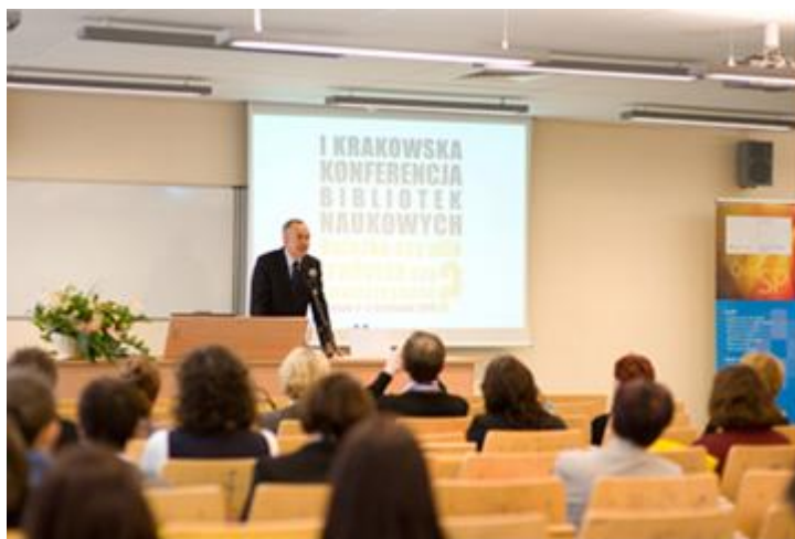
Il. 5. I Krakowska Konferencja Bibliotek Naukowych

Wraz z pracownikami Biura ds. Osób Niepełnosprawnych KAAFМ podjęto starania o zawarcie umowy z Akademicką Biblioteką Cyfrową Uniwersytetu Warszawskiego (ABC UW), udostępniającą zasoby przystosowane dla użytkowników niepełnosprawnych wzrokowo 5 . Współpraca z ABC będzie się opierać na wykupieniu zdalnego dostępu do zasobów tej bazy dla studentów KAAFМ. Biblioteka planuje czynnie włączyć się w powiększanie dorobku ABC poprzez skanowanie książek i czasopism, które nie są jeszcze dostępne w bazie. Dostęp do kolekcji ABC UW, dwa profesjonalne skanery oraz papier do drukarki brajlowskiej zostaną sfinansowane ze specjalnej dotacji przyznawanej przez MNiSW w ramach wsparcia studentów niepełnosprawnych 6 . Lata 2010–2013 to okres planowania i realizacji rozmaitych przedsięwzięć w bibliotece KAAFМ, na realizację których udało się pozyskać środki z MNiSW. Wśród przedstawicieli władz uczelni oraz pracowników biblioteki zrodziła się inicjatywa organizacji I Krakowskiej Konferencji Bibliotek Naukowych. Pierwsza konferencja pt. „Książka czy plik, tradycja czy nowoczesność” (4–5 listopada 2010 r.) była finansowana z budżetu uczelni oraz środków otrzymanych od sponsorów.