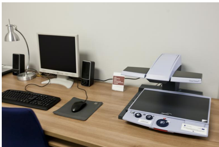
Il. 3. Sprzęt komputerowy dostosowany do potrzeb osób niewidomych i słabo widzących otrzymany w 2012 r.

Na początku roku 2012, w ramach projektu „Umiejdzynarodowienie Krakowskiej Akademii im. Andrzeja Frycza Modrzewskiego” realizowanego w ramach programu operacyjnego Kapitał Ludzki, priorytet IV, działanie 4.1, poddziałanie 4.1.1, w Bibliotece KAAFM stworzono dodatkowych sześć stanowisk komputerowych, wyposażonych w urządzenia ułatwiające osobom niewidomym i niedowidzącym korzystanie z materiałów dydaktycznych: trzy skanery, powiększalnik stacjonarny Clear View + PC, drukarkę brajlowską View Plus Max. Komputery wyposażone zostały w specjalistyczne oprogramowanie: syntezytor mowy Loquendo, oprogramowanie udźwiękawiająco-ubrajlawiające JAWS, oprogramowanie powiększające zawartość ekranu – MAGIc. Stanowiska rozlokowane są w następujących miejscach: jedno w Oddziale Informacji Naukowej, trzy stanowiska znajdują się w Czytelnii Głównej, dwa w Pokoju Cichej Pracy.