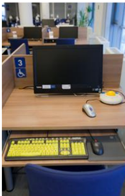
Il. 2. Sprzęt komputerowy dostosowany do potrzeb osób niewidomych i słabo widzących otrzymany w 2011 r.

Założeniem kilku edukacyjnych i badawczych projektów realizowanych w Krakowskiej Akademii, a finansowanych ze środków UE, było stworzenie warunków do studiowania dla osób niepełnosprawnych. Na początku 2011 r. biblioteka otrzymała sprzęt komputerowy dostosowany do potrzeb osób niewidomych i słabo widzących. Nowe stanowisko komputerowe współfinansowała UE w ramach Europejskiego Funduszu Społecznego 4 .