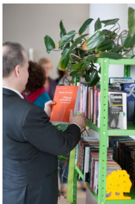
Il. 1. Otwarcie półki bookcrossingowej

Założeniem kilku edukacyjnych i badawczych projektów realizowanych w Krakowskiej Akademii, a finansowanych ze środków UE, było stworzenie warunków do studiowania dla osób niepełnosprawnych. Na początku 2011 r. biblioteka otrzymała sprzęt komputerowy dostosowany do potrzeb osób niewidomych i słabo widzących. Nowe stanowisko komputerowe współfinansowała UE w ramach Europejskiego Funduszu Społecznego 4 .