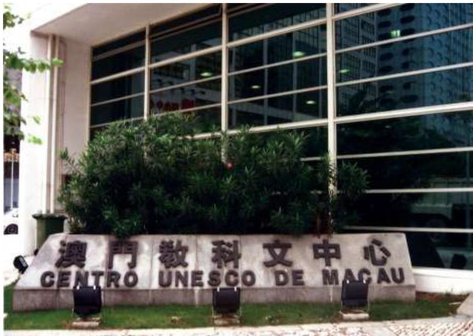
Il. 1. Budynek Centrum UNESCO w Makau

Centrum zlokalizowano w nowoczesnym budynku o powierzchni 680 m 2 .