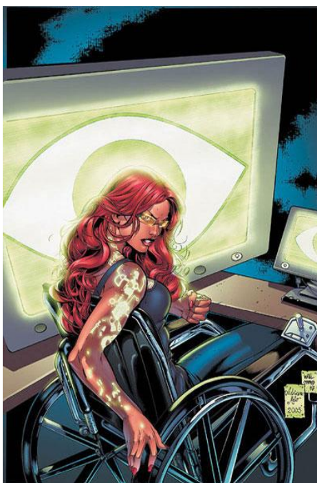
Il. 9. Barbara Gordon

Mimo że w wydawnictwach komiksowych pojawiają się przykłady sylwetek bibliotekarzy przedstawionych w pozytywnym świetle, to jednak nadal w świadomości pokutuje przekonanie, że praca w bibliotece jest zajęciem nudnym i mało ambitnym, a osoby ją wykonujące utożsamia się z ludźmi mruklivymi, szarymi, źle ubranymi i nie lubiący- mi nowości technologicznych.