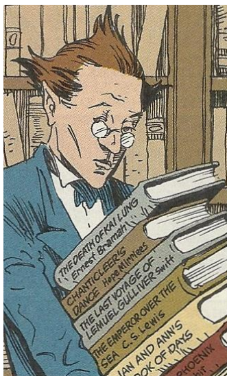
Il. 6. Lucien

Lucien (serie Sandman i The Dreaming , DC Comics) jest głównym bibliotekarzem w „ The Dreaming ”, wymiarze, w którym władzę sprawuje Morfeusz.