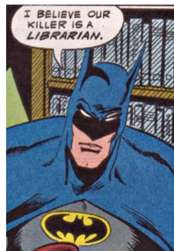
Il.5. Library of Souls

Źródło: Detective Comics , DC Comics, 1992, nr 643, s. 8.