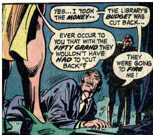
Il. 2. Who Stole the Gift from Nowhere?

W Who Stole the Gift from Nowhere? (wydanym w komiksie Batman nr 245 z 1972 r.) Elliot Maggi opowiada losy Robina – pomocnika głównego bohatera, który musi rozwiązać zagadkę kradzieży 50 tys. dolarów przekazanych na bibliotekę uniwersytecką w Hudson.