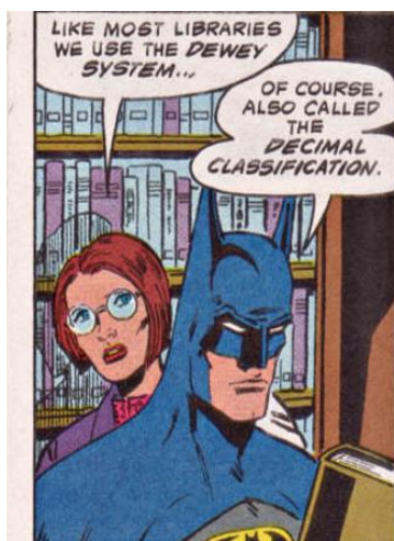
Il. 4 Library of Souls .

W mieście Gotham ktoś podrzuca zwłoki osób z napisanymi na nich tajemniczymi numerami. Batman rozwiązuje zagadkę dzięki pomocy bibliotekarki Jenny Hadley, która identyfikuje znaczenie tajemniczych liczb na zwłokach. Batman domyśla się, co oznaczają numery, i zgłębia system klasyfikacji książek Melvina Deweya. Pomaga mu to odnaleźć miejsce podrzucenia kolejnych zwłok i schwytać mordercę.