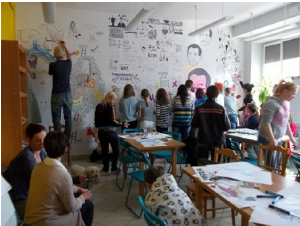
Fot. 4. Malowanie ściany w czytelnicy Filii nr 2 MBP przy Gimnazjum nr 12 we Wrocławiu

Miejska Biblioteka Publiczna we Wrocławiu bierze udział w wielu konkursach ogłoszonych m.in. przez MKiDN. Dzięki otrzymanym grantom możliwa jest realizacja większej liczby projektów upowszechniających kulturę i czytelnictwo. Zasięgiem swoim często obejmują one też filie zlokalizowane w szkołach. Dzięki temu do uczniów łatwiej dociera informacja o ofercie, jaką ma dla nich MBP.