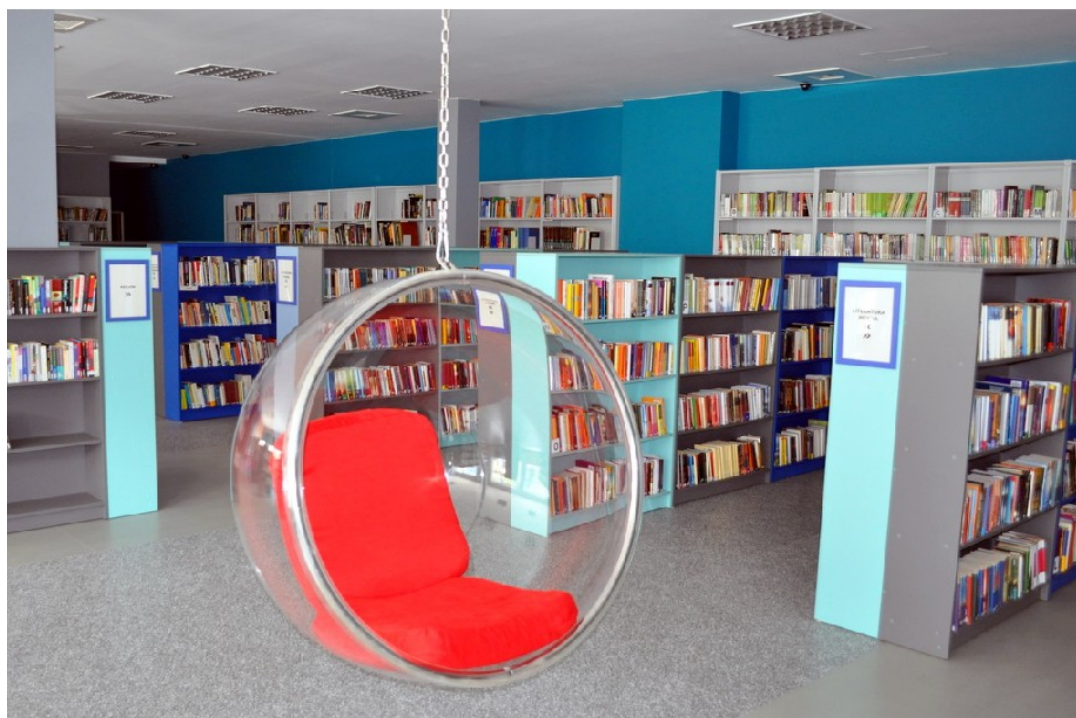
Fot. 2. Huśtawka w Filii nr 4 MBP przy Szkole Podstawowej nr 17 we Wrocławiu

Osobne wejście od strony szkoły dla uczniów i nauczycieli oraz osobne z zewnątrz dla pozostałych czytelników są dogodne dla wszystkich użytkowników biblioteki. Nowe biblioteki są przestronne i ładnie zaaranżowane. Wyposażono je w funkcjonalne meble i komputery z dostępem do Internetu. Urządzone zostały specjalne, przyjazne miejsca dla dzieci i młodzieży.