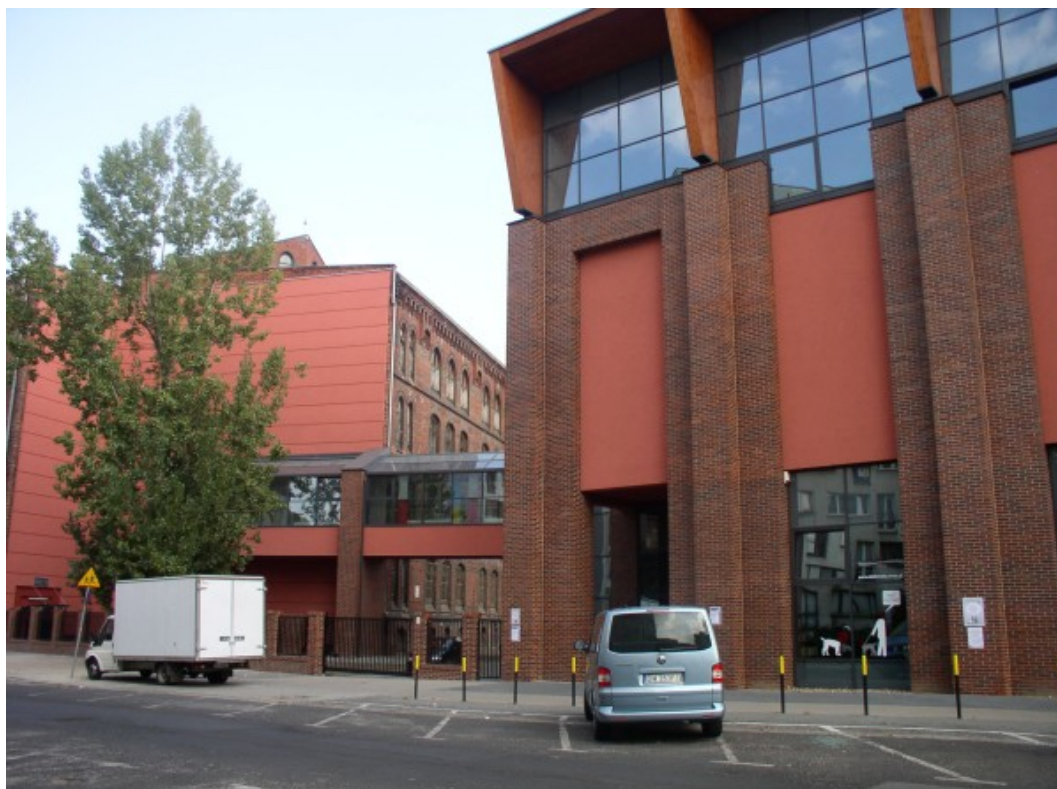
Fot. 1. Filia nr 29 MBP przy Gimnazjum nr 13 we Wrocławiu

W ośmiu szkołach lokale dla bibliotek zostały zaprojektowane i wybudowane od podstaw.