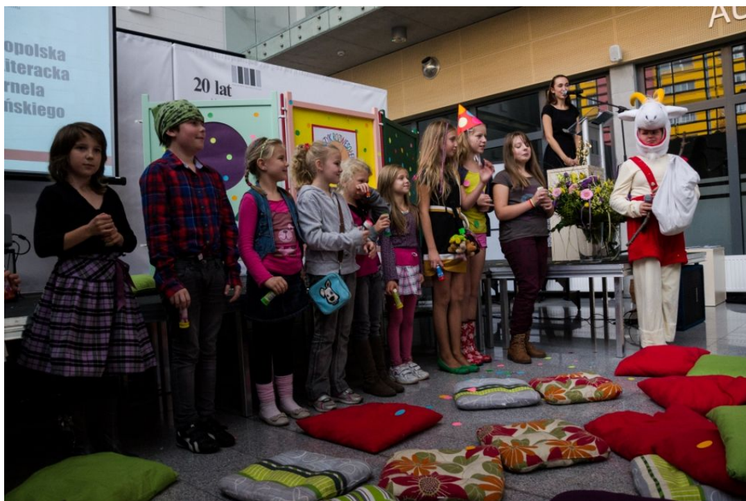
Fot. 3. Uroczystość wręczenia statuetki Koziołka Matołka.