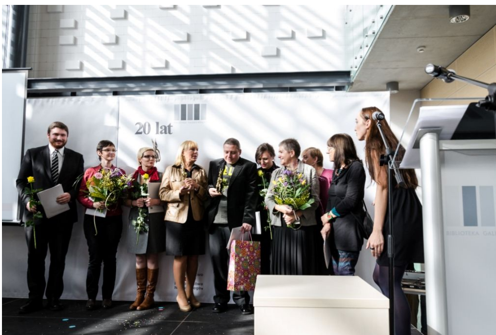
Fot. 4. Uroczystość wręczenia statuetki Koziołka Matołka .

Nagrodę specjalną — Super Koziołka jury postanowiło przyznać Wandzie Chotomskiej w uznaniu całego jej dorobku pisarskiego i kulturotwórczego, a w szczególności za zgłoszony do konkursu utwór Miotła i ptak opublikowany w serii „Perełki Mili” przez Wydawnictwo Mila z Poznania — piękną baśń andersenowską, pochwałą radości życia, wierności w przyjaźni i wytrwałego dążenia do celu, wzbogaconą znakomitymi, poetyckimi tekstami piosenek.