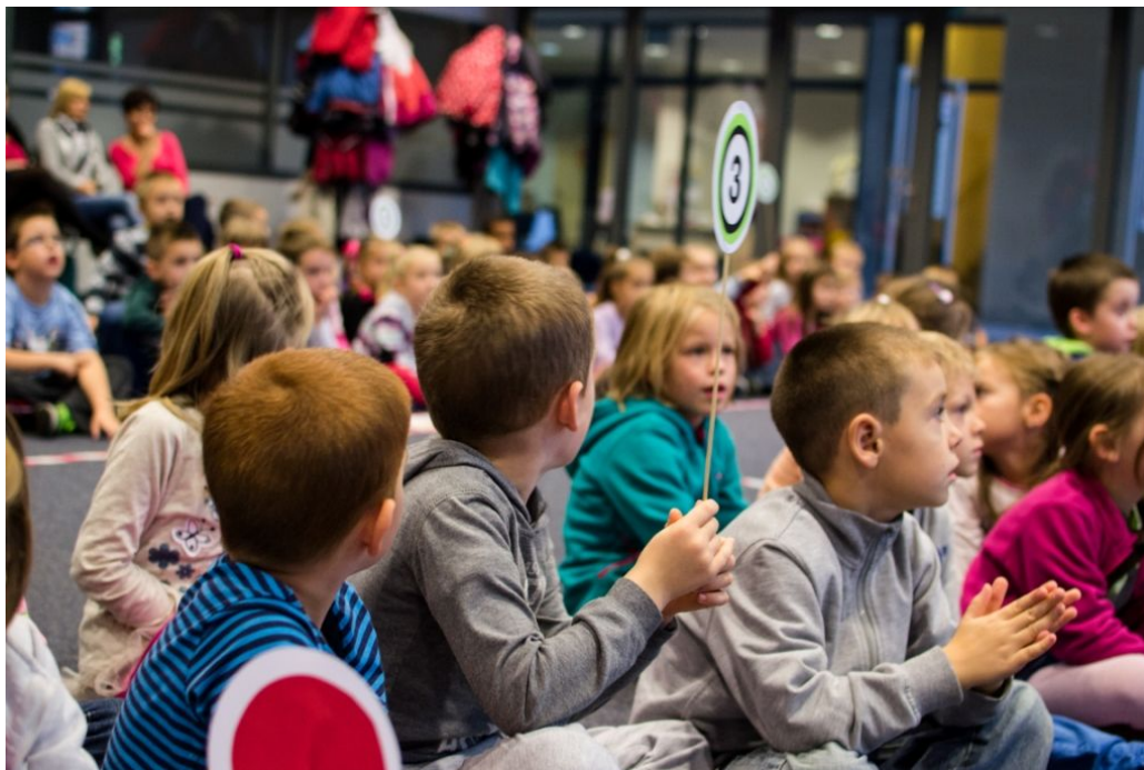
Fot. 2. Uroczystość wręczenia statuetki Koziołka Matołka.