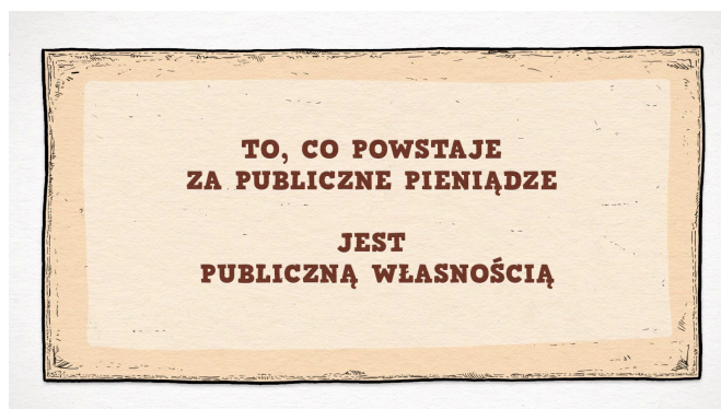
Il. 1. Czosnek Studio (Tymek Borowski), To Zachęta dla wszystkich , 2013, kadr wideo, CC BY-SA.

Tak powstał projekt „Otwarta Zachęta”, który łączy we wspólnym celu różne działy galerii: edukacji, zbiorów, dokumentacji, promocji, wydawnictw czy administracji. Istotny jest fakt, że to pracownicy i dyrekcja Zachęty są autorami tej strategii, ponieważ dzięki temu może być ona sprawnie i z przekonaniem realizowana. Otwartość rozumiemy bardzo szeroko. Nie jest to wyłącznie digitalizacja i udostępnianie zbiorów Zachęty, lecz wszystko, co wiąże się z dostępnością budynku, edukacją, otwarciem na grupy do tej pory wykluczone. Projekt wpłynął na nasz sposób myślenia o tym, co robimy i do kogo kierujemy nasze działania.