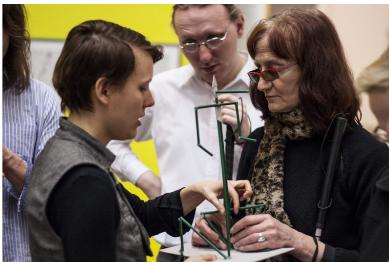
Il. 2. Warsztaty Sztuka dostępna, 2013, Zachęta, fot. Paulina E. Rutkowska.

Od 2012 r. dla osób z dysfunkcją wzroku prowadzimy warsztaty „Sztuka dostępna”, podczas których na przykładzie prac z kolekcji Zachęty przedstawiamy najważniejsze zjawiska w polskiej sztuce współczesnej. Część dzieł z naszej kolekcji opracowaliśmy w technice tyflografiki, dzięki czemu uczestnicy warsztatów mogą poznać przez dotyk także malarstwo, grafikę czy fotografie. Natomiast cykl „Warsztat na Zachętę”, zrealizowany we współpracy z Fundacją Kultury bez Barrier, miał charakter warsztatów integracyjnych dla osób z niepełnosprawnością sensoryczną. Efektem tych spotkań było opracowanie pakietów edukacyjnych umożliwiających aktywne, kompetentne i samodzielne poznawanie sztuki współczesnej. Do naszych dobrych praktyk należy także przygotowywanie audiodeskrypcji oraz organizowanie spotkań z tłumaczeniami na Polski Język Migowy.