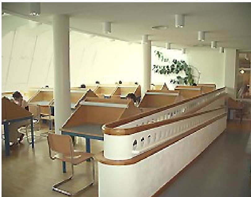
Il. 3. Czytelnia