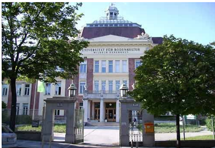
Il. 1. Wilhelm Exner Haus — siedziba Biblioteki Uniwersyteckiej

W dniach 2–6 grudnia 2013 r. uczestniczyłem w szkoleniu w ramach The Lifelong Learning Programme ERASMUS. Szkolenie odbyło się w Bibliotece Głównej Universität für Bodenkultur Wien (Uniwersytet Rolniczy). Uczelnia została założona w 1872 r. jako centrum naukowo-badawcze zajmujące się odnawialnymi źródłami energii. Obecnie studiuje w niej około 10,5 tys. osób.