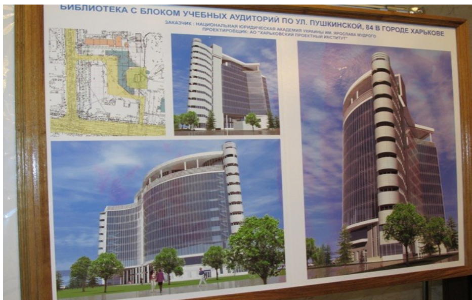
Il. 12. Wizualizacja gmachu Biblioteki Narodowego Uniwersytetu Prawniczego im. Jarosława Mądrego w Charkowie