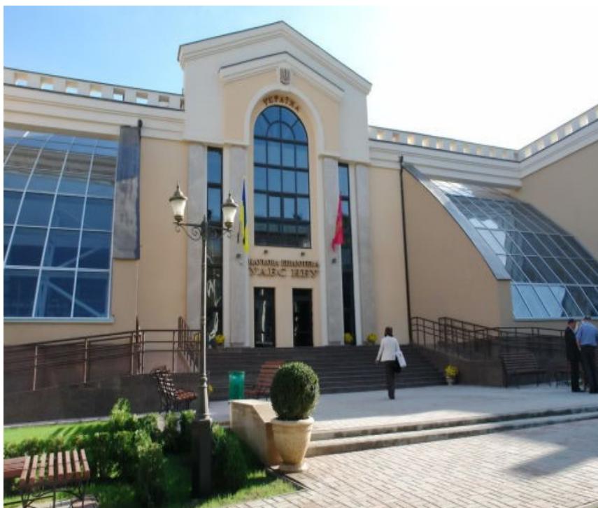
Il. 1. Biblioteka Naukowa Ukraińskiej Akademii Bankowości Narodowego Banku Ukrainy