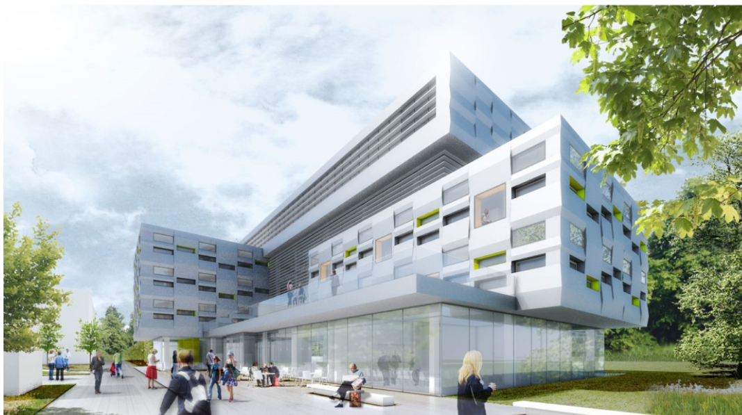
Il. 11. Wizualizacja gmachu Centrum informacyjne UKU we Lwowie.