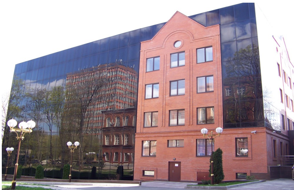
Il. 4. Biblioteka Narodowego Uniwersytetu Technicznego „Charkowski Instytut Politechniczny”

W 2004 r. zatwierdzono projekt budowy Centrum Bibliotecznego-Informacyjnego Donieckiego Narodowego Uniwersytetu Technicznego, wykonany w Pracowni Architektonicznej Среда działającej przy Związku Architektów Doniecka, przypominający nieco gmach Biblioteki Uniwersytetu Technicznego w Magdeburgu (Niemcy). Gmach o czterech kondygnacjach ma wygląd otwartej książki.