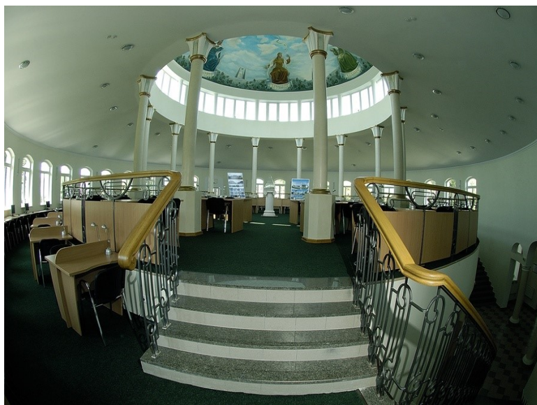
Il. 7. Centrum komputerowe, na kolumnie gabłota z unikatowym wydawnictwem „Biblij Ostrogskiej”

Biblioteka otrzymuje finansowe wsparcie m.in. z Międzynarodowego Dobroczytnego Funduszu Odrodzenia Akademii Ostrogskiej, otwartego w 2001 r., jak również z datków mecenasów 6 . Koncepcję tej „hybrydowej” biblioteki podkreśla fakt, że w centrum czytelni wyposażonej w stanowiska komputerowe, na kolumnie umieszczono unikatową Biblię Ostrogską z 1581 r.