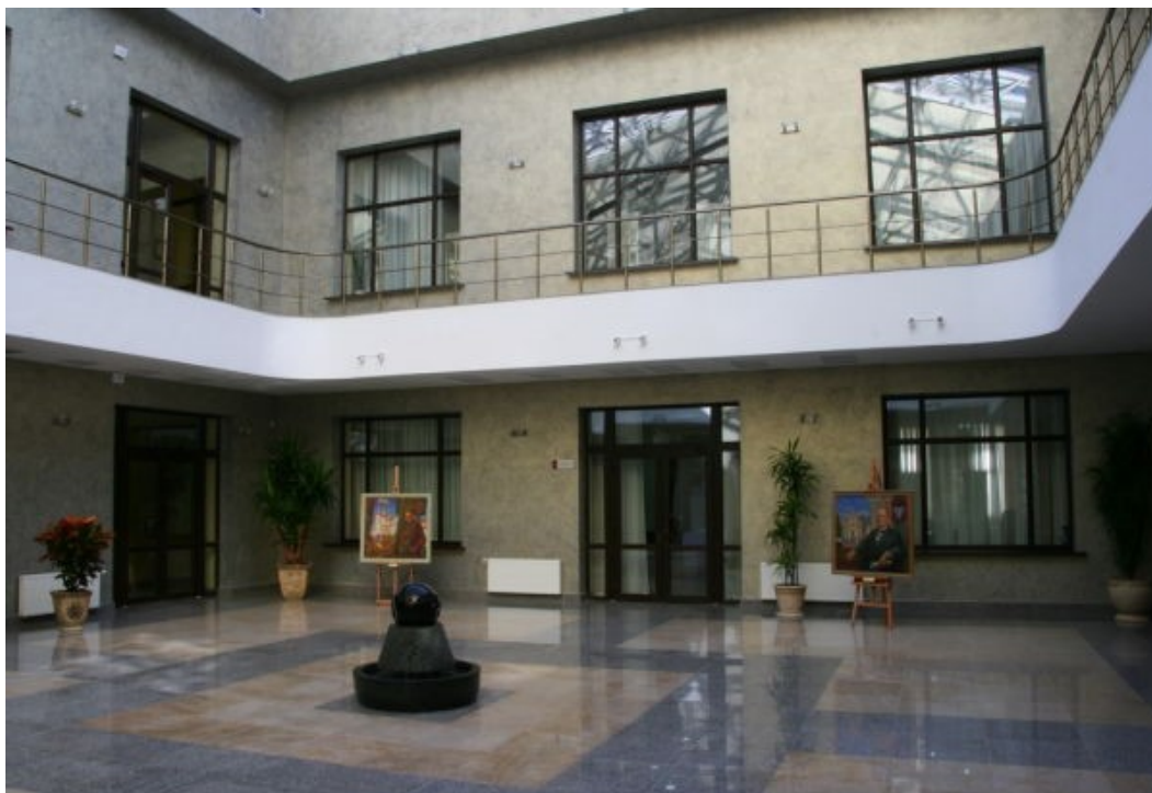
Il. 3. Atrium biblioteki wykorzystywane w celach promocyjnych