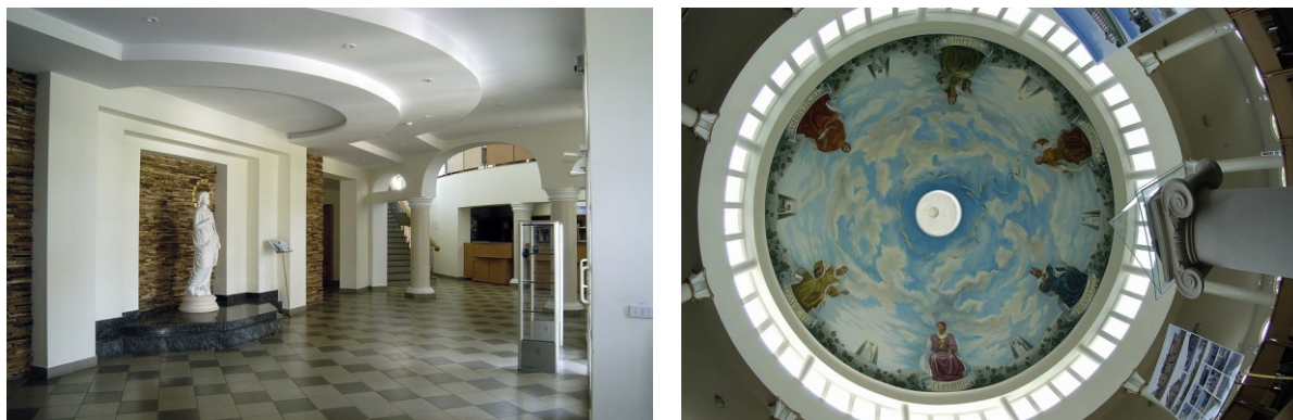
Il. 8–9. Hol, który zdobi rzeźba T.O. Sosnowskiego; kopia czytelnia zdobiona malarstwem O. Chernyushka

Gmach biblioteki ma okrągły kształt. We wnętrzu znajduje się magazyn na ponad 500 tys. woluminów książek. Przy wejściu umieszczono marmurową płytę z nazwiskami dobroczyńców, którzy przekazali fundusze na budowę. Hol zdobi autentyczna rzeźba Tomasza Oskara Sosnowskiego (1810–1886) — urodzonego w tych okolicach, a czytelnię obrazy wykonane przez artystę z Równego — O. Chernyushka.