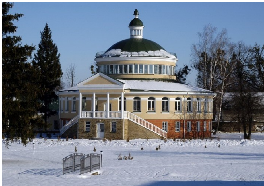
Il. 6. Biblioteka Naukowa Uniwersytetu Narodowego „Ostrogska Akademia”

Biblioteka otrzymuje finansowe wsparcie m.in. z Międzynarodowego Dobroczytnego Funduszu Odrodzenia Akademii Ostrogskiej, otwartego w 2001 r., jak również z datków mecenasów 6 . Koncepcję tej „hybrydowej” biblioteki podkreśla fakt, że w centrum czytelni wyposażonej w stanowiska komputerowe, na kolumnie umieszczono unikatową Biblię Ostrogską z 1581 r.