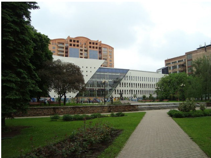
Il. 5. Budowa Biblioteki Donieckiego Narodowego Technicznego Uniwersytetu