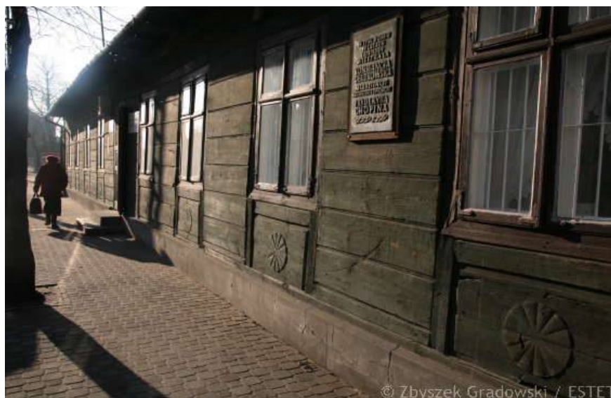
Il. 5. Dworek modrzewiowy, najstarszy drewniany budynek w Skierniewicach — siedziba Izby Historii Skierniewic.

Pierwsze pozycje wpisano do inwentarza 2 lipca 1993 r. Publikacje stanowiące własność Towarzystwa Przyjaciół Skierniewic, dla rozróżnienia, opatrywane są stosowną adnotacją przy numerze inwentarzowym.