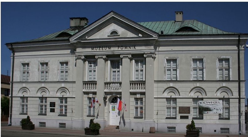
Il. 2. Siedziba Muzeum Ziemi Sochaczewskiej i Pola Bitwy nad Bzurą — Muzeum Pomnik.

Zgodnie z chronologią nadsyłania odpowiedzi na pytania zawarte w ankiecie, pierwszeństwo przypada księgozbiorowi Biblioteki Naukowej Muzeum Ziemi Sochaczewskiej i Pola Bitwy nad Bzurą . Muzeum ma status samorządowej instytucji kultury miasta Sochaczewa. Księga inwentarzowa księgozbioru muzeum rozpoczyna się wpisem z dnia 15 marca 1976 r., zatem tę właśnie datę traktować należy jako początek istnienia księgozbioru. Księgozbiór jest zatem starszy niż samo muzeum, które rozpoczęło swą działalność w styczniu 1977 r. Muzeum przejęło bowiem zbiory biblioteczne Stowarzyszenia Miłośników Ziemi Sochaczewskiej, stąd wiele starszych publikacji opatrzonych jest pieczętą tego stowarzyszenia.