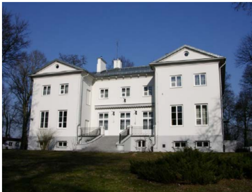
Il. 4. Pałac Zabłockich w Rybnie — siedziba m.in. Oddziału Muzeum Archeologicznego w Warszawie.

Charakter specjalistyczny ma również księgozbiór Oddziału Państwowego Muzeum Archeologicznego w Warszawie , znajdującego się w Rybnie koło Sochaczewa. Oddział ten działa jako ośrodek magazynowo-studyjny od lat 80. XX w.