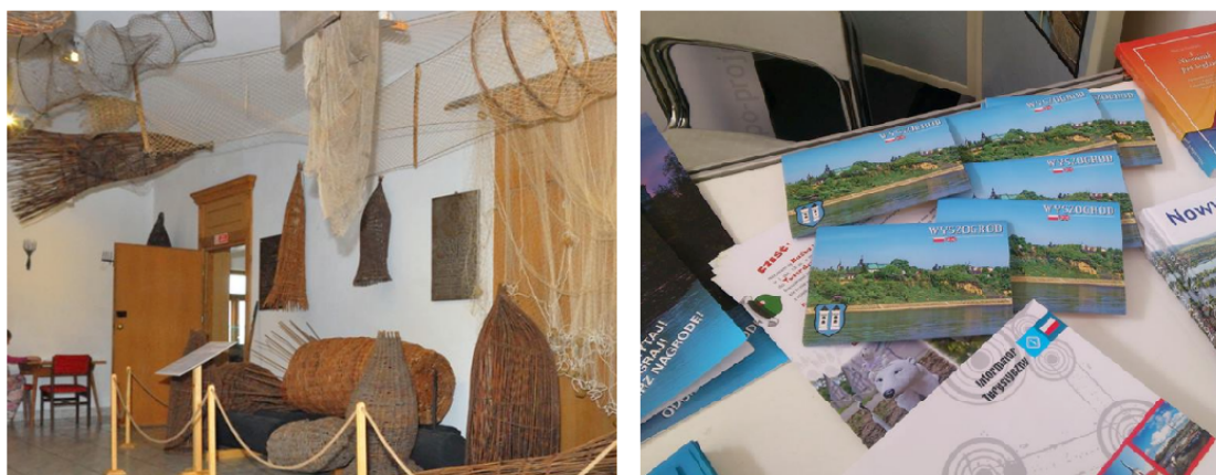
Il. 6. Ekspozycja w Muzeum Wisły w Wyszogrodzie oraz stoisko z publikacjami i folderami na 26. Targach Sportów Wodnych i Rekreacji „Wiatr i Woda”.

Ostatni z analizowanych zbiorów stanowi księgozbiór Muzeum Wisły w Wyszogrodzie . Jest to również najmłodsza z placówek objętych badaniem, została bowiem otwarta w czerwcu 2012 r. Muzeum powstało w ramach Centrum Kultury „Wisła”, które stanowi instytucję kultury samorządu miasta i gminy Wyszogród.