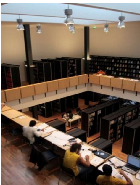
Fot. 1. Biblioteka Wydziału FCT Nowego Uniwersytetu Lizbońskiego.

Księgozbiór biblioteki w większości składa się z książek anglojęzycznych, gdyż w Portugalii nie ma tradycji wydawania tłumaczeń książek naukowych i podręczników akademickich. Dużo bardziej opłacalny jest zakup książki w oryginale. Ponadto wydzielona część zbiorów to książki beletrystyczne, z których studenci, mimo że z kierunków technicznych, chętnie korzystają.