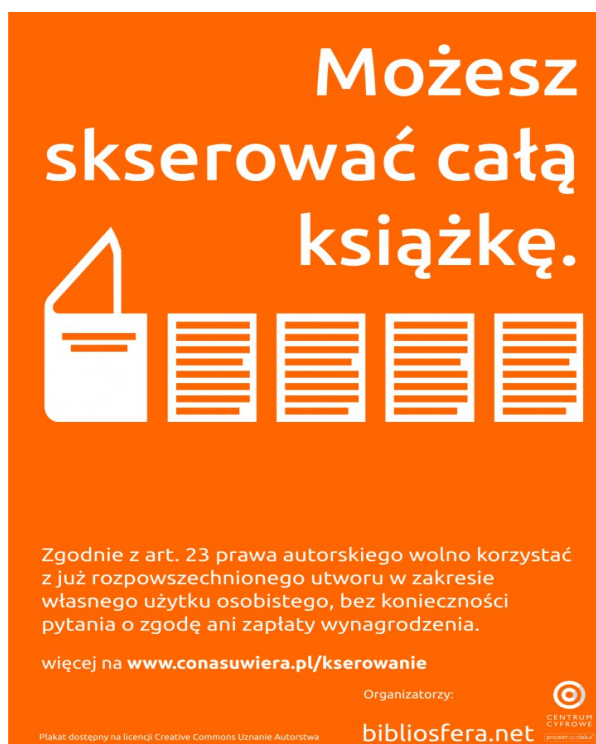
Rys. 6. Plakat Centrum Cyfrowego.

Academica niczego nie ułatwia czytelnikom, a na biblioteki nakłada szereg niebezpiecznych obowiązków, których te nigdy nie brały na siebie. Biblioteka nie jest i nie powinna być prokuratorem ścigającym łamiących prawo, każdy dorosły obywatel łamiący prawo autorskie sam odpowiada przed sądem za jego złamanie. Biblioteka powinna zrobić wszystko, by poszerzać krąg czytających, szczególnie czytających nieanalogowo, bo takich jest coraz więcej.