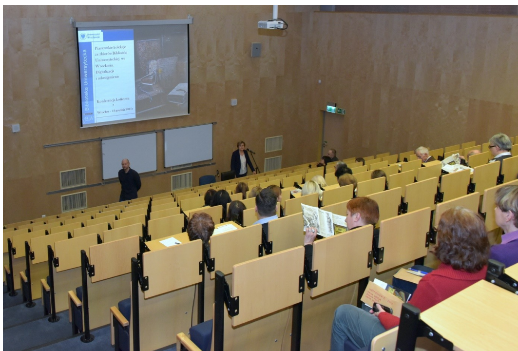
Fot. 1. Zdjęcie z otwarcia konferencji.