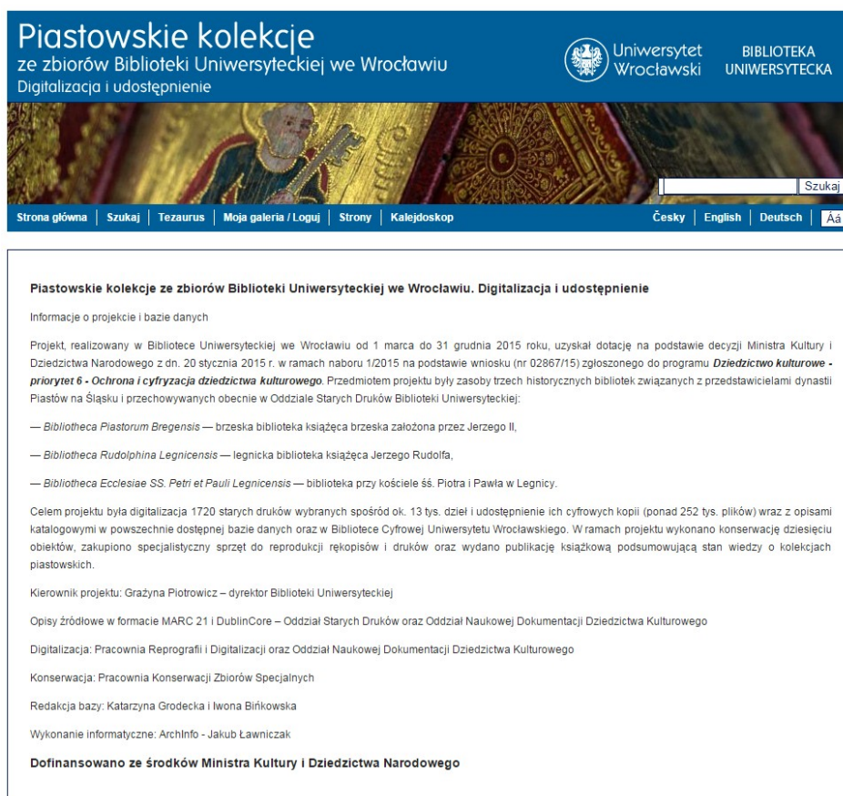
Fot. 3. Fragment portalu tematycznego Dziedzictwo kulturowe w badaniach Biblioteki Uniwersyteckiej we Wrocławiu , poświęcony Piastowskim kolekcjom.

Zbiory objęte projektem zostały też opracowane w formacie MARC 21 dla starych druków (sporządzono rekordy bibliograficzne i rekordy haseł wzorcowych), a powstałe rekordy wprowadzono do narodowego centralnego katalogu NUKAT. Ponadto, wykonano opisy w formacie Dublin Core stosowanym w Bibliotece Cyfrowej UWrocław. Analogicznie wykonywano też opisy zgodne ze standardem MIDAS – do publikacji na podstronie portalu Dziedzictwo kulturowe w badaniach Biblioteki Uniwersyteckiej we Wrocławiu . Udostępnienie w sieci zdigitalizowanych dzieł z kolekcji piastowskiej zostało zrealizowane poprzez dwie platformy: Bibliotekę Cyfrową Uniwersytetu Wrocławskiego (BCUWr) ( http://www.bibliotekacyfrowa.pl/dlibra ) oraz podstronę w portalu tematycznym Dziedzictwo kulturowe w badaniach Biblioteki Uniwersyteckiej we Wrocławiu ( http://dk.bu.uni-wroc.pl/bp ).