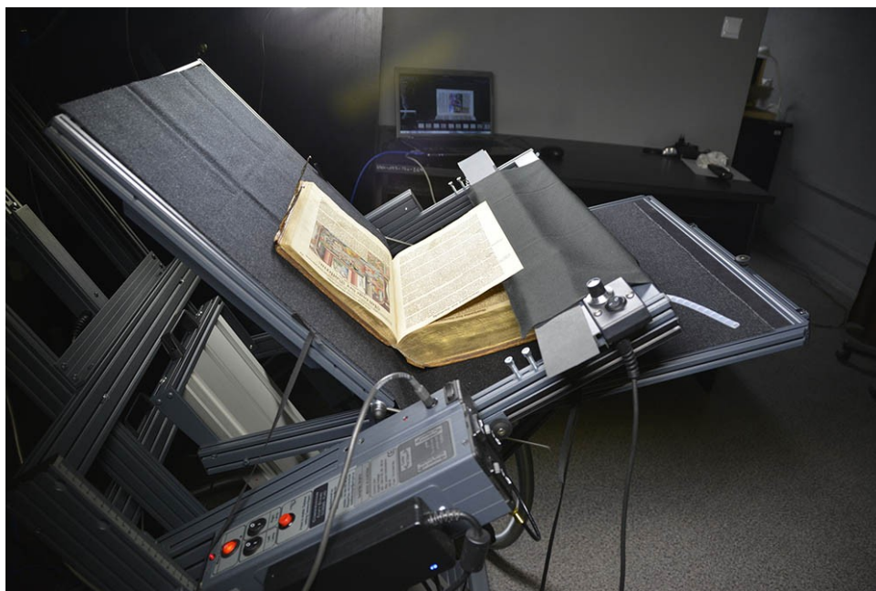
Fot. 2. Grazer Buchtisch.

Prelegentka poinformowała uczestników konferencji, że realizatorami projektu byli pracownicy oddziałów zbiorów specjalnych Biblioteki, którzy większość prac wykonali na zasadzie oddelegowania w ramach umowy o pracę. Niektóre zadania zrealizowano bezkosztowo (eseje w końcowej publikacji książkowej, referaty na konferencję, materiały dla mediów), a dofinansowanie z MKiDN na pokrycie kosztów wynagrodzeń z tytułu umów cywilno-prawnych ograniczyło się do wynagrodzenia za digitalizację 720 obiektów wraz z archiwizacją plików master. Dyrektorka Piotrowicz podkreśliła też, że dzięki dotacji ministerialnej, stan posiadania Biblioteki wzbogacił się o specjalistyczny skaner w postaci stołu do reprodukcji rękopisów i cennych druków typu „Grazer Buchtisch” oraz o wysokiej jakości sprzęt fotograficzny i system do zarządzania kolorem.