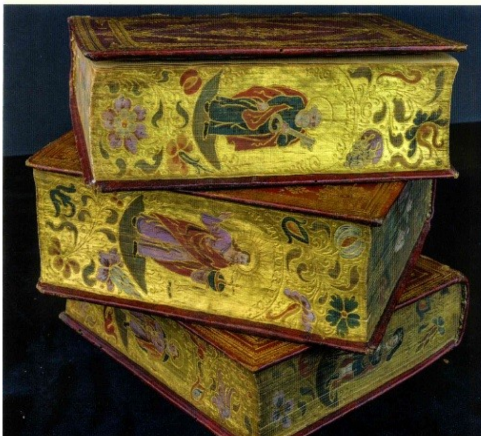
Fot. 5. Fragment polskojęzycznej ulotki informacyjnej na temat projektu Piastowskie kolekcje ...

Projekt realizowany w Bibliotece Uniwersyteckiej we Wrocławiu od 1 marca do 31 grudnia 2015 roku, uzyskał dotację na podstawie decyzji Ministra Kultury i Dziedzictwa Narodowego z dn. 20 stycznia 2015 r. w ramach naboru 1/2015 na podstawie wniosku nr 02867/15, zgłoszonego do programu Dziedzictwo kulturowe - priorytet 6 - Ochrona i cyfryzacja dziedzictwa kulturowego.