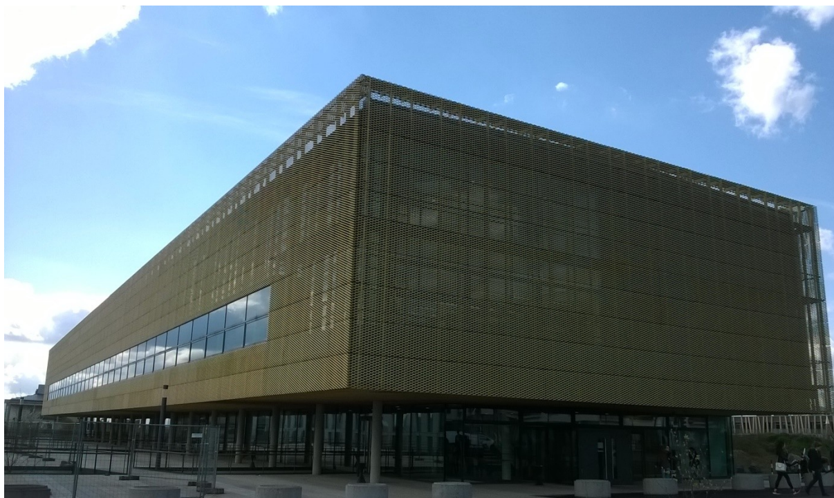
Il. 4. Budynek, w którym mieści się Biblioteka Nauk Przyrodniczych.

Biblioteka jest zlokalizowana na kampusie Riedberg. Jest czynna od poniedziałku do piątku od 8.00 do 20.00 i w soboty od 10.00 do 16.00. Wypożyczalnia i informacja pracuje od poniedziałku do piątku w godzinach 8–18. Pomieszczenia do pracy grupowej są czynne od poniedziałku do piątku od 8.00 do 22.30 oraz w soboty i niedziele od 10.00 do 19.00. Poza godzinami otwarcia biblioteki dostęp do pomieszczeń do pracy grupowej jest możliwy tylko z korytarza przez drzwi otwierane za pomocą Goethe-Card. Biblioteka mieści się na dwóch piętrach w nowoczesnym budynku rozbudowywanego kampusu uniwersyteckiego.