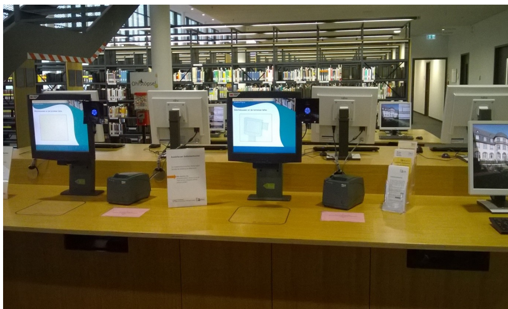
II. 6. Selfchecki – Biblioteka Nauk Przyrodniczych.