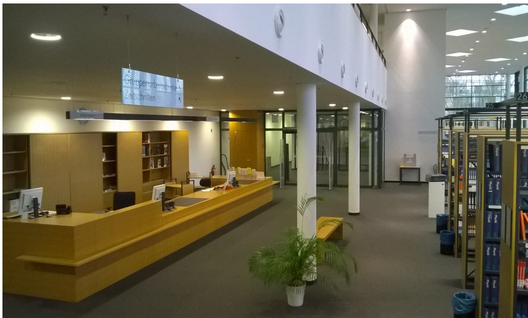
II. 7. Wypożyczalnia – Biblioteka Nauk Przyrodniczych.

Istnieje możliwość zamawiania części zbiorów z Biblioteki Centralnej i odebrania ich w bibliotece na kampusie Riedberg. Informacja o tym, które egzemplarze można w ten sposób zamówić jest dostępna w katalogu on-line. Czas oczekiwania na dostawę zamówionych pozycji to około 3 dni. Biblioteka zatrudnia 10 bibliotekarzy.