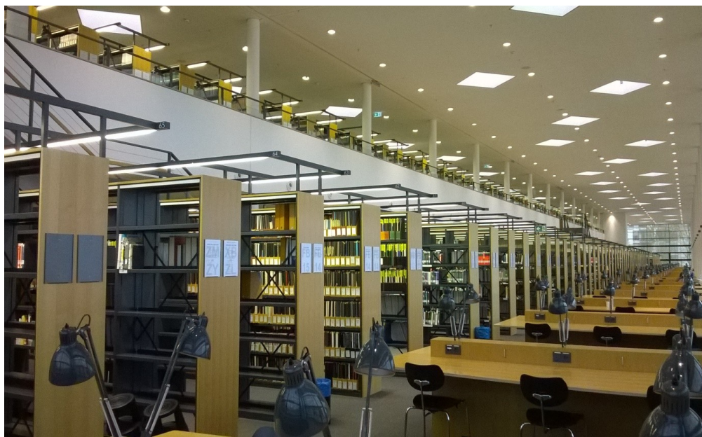
II. 5. Czytelnia w Bibliotece Nauk Przyrodniczych.

w godzinach otwarcia wypożyczalni lub do wrzutni znajdującej się poza biblioteką. Jak przyznają bibliotekarze, wrzutnia nie jest idealnym rozwiązaniem, ponieważ część zbiorów ulega zniszczeniu w momencie, gdy wpadają do kosza. Części nie da się już naprawić i muszą zostać wymienione. Do wrzutni można wrzucać tylko książki z Biblioteki Nauk Przyrodniczych. Nie wypożycza się czasopism, za to można je kopiować na dostępnych w bibliotece dwóch kserokopiarkach. Liczba zbiorów to około 300 tys. jednostek.