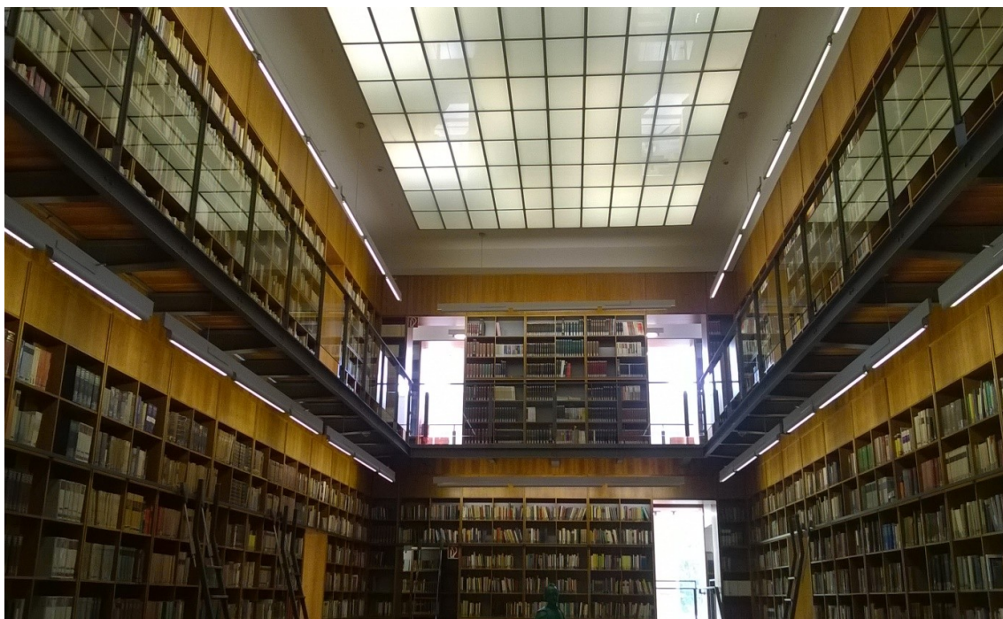
Il. 3. Jedna z czytelni Biblioteki Nauk Humanistycznych.

Biblioteka zlokalizowana jest na kampusie Westend w budynku byłej siedziby niemieckiego koncernu chemicznego IG-Farben. Otwarta jest od 8.00 do 22.00 od poniedziałku do piątku i od 10.00 do 18.00 w soboty. Wypożyczalnie są czynne od poniedziałku do piątku w godzinach 9–17 i w czwartki w godzinach 9–19. Punkt informacji jest czynny od poniedziałku do piątku od 10.00 do 17.00.