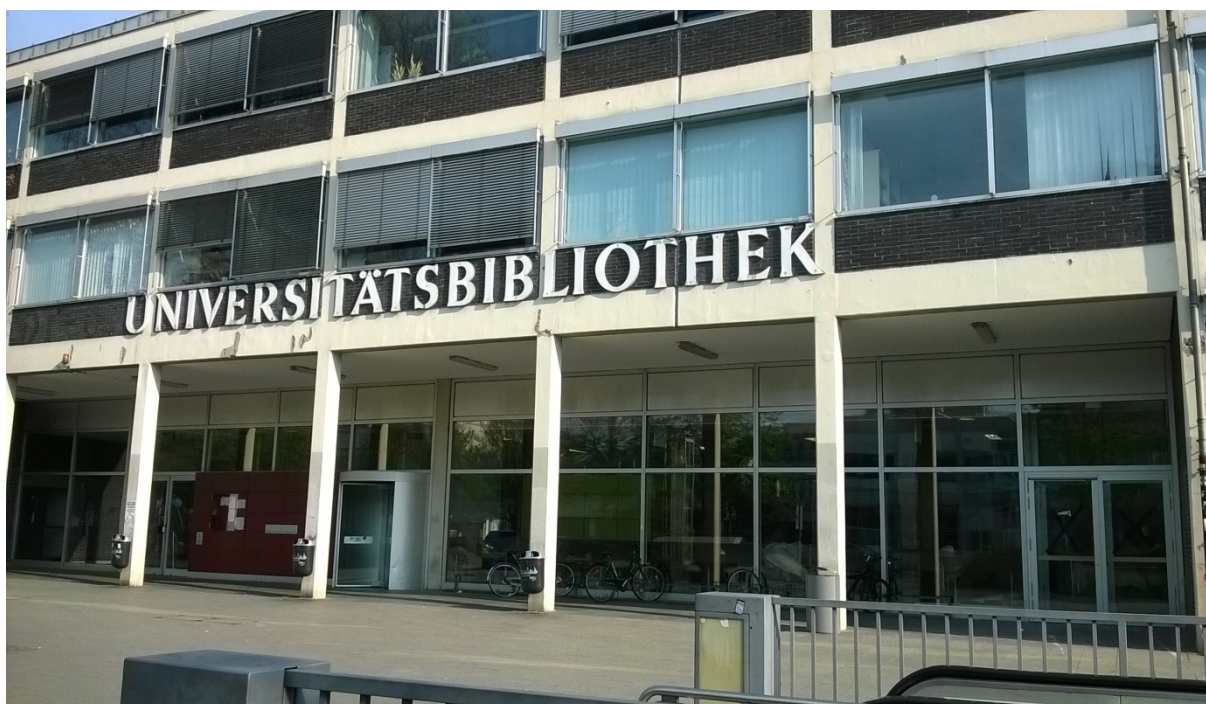
II. 1. Biblioteka Centralna.

glądania katalogu nie jest wymagane posiadanie konta bibliotecznego. Wyszukiwanie jest możliwe poprzez standardowe indeksy, takie jak indeks tytułów czy indeks autorów. Katalog daje też możliwość zawężania wyników wyszukiwania poprzez zakres dat, język czy lokalizację. Katalog informuje o dostępności danej pozycji, jej lokalizacji oraz sposobie udostępniania. Jest prosty i intuicyjny, dlatego każdy może w łatwy sposób dotrzeć do poszukiwanej literatury. Zbiory można przeszukiwać za pomocą multiwyszukiwarki indeksującej również zawartość katalogu on-line, tzw. Frankfurter Suchportal. Za pomocą multiwyszukiwarki można dotrzeć także do pełnych tekstów i odnośników do baz danych.