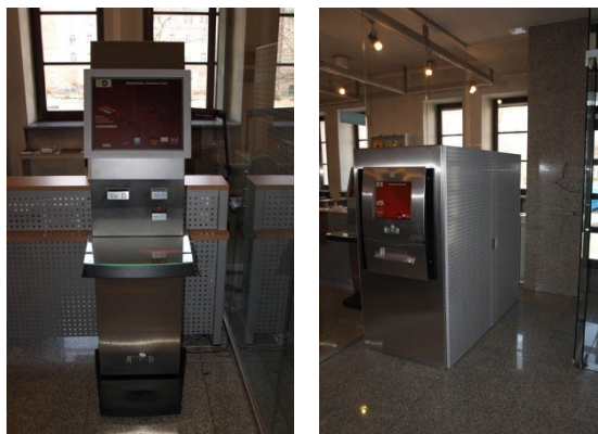
Fot. 3. Stanowiska do wypożyczeń i zwrotów publikacji

Dodatkowo biblioteka udostępnia czytelnikom selfcheck do samodzielnych wypożyczeń i wrzutnię do samodzielnych zwrotów (czynną 24 h). W bieżącym roku akademickim biblioteka wdrożyła system RFID do obsługi Elektronicznej Legitymacji Studenckiej (ELS) w systemie bibliotecznym Horizon . Obecnie rozpoczęto prace nad poszerzeniem funkcji systemu Horizon do wersji chmurowej. Warto nadmienić, że w bibliotece czytelnicy mogą podłączyć się do ogólnouczelnianego punktu dostępowego WiFi.