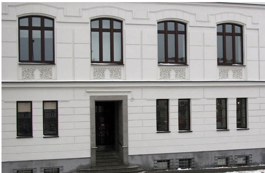
Fot. 1. Gmach Biblioteki Głównej Uniwersytetu Artystycznego w Poznaniu

Uniwersytet Artystyczny w Poznaniu obchodzi w tym roku 97-lecie istnienia. Historia Uniwersytetu Artystycznego sięga roku 1919, kiedy to w Poznaniu założono Państwową Szkołę Sztuk Zdobniczych, którą następnie przekształcono w Instytut Sztuk Plastycznych. W 1946 r. na jego podwalinach powstała Państwowa Wyższa Szkoła Sztuk Plastycznych, w roku 1996 zmieniono nazwę na Akademia Sztuk Pięknych, a 7 lipca 2010 r. decyzją władz RP uczelnię przemianowano na Uniwersytet Artystyczny w Poznaniu.