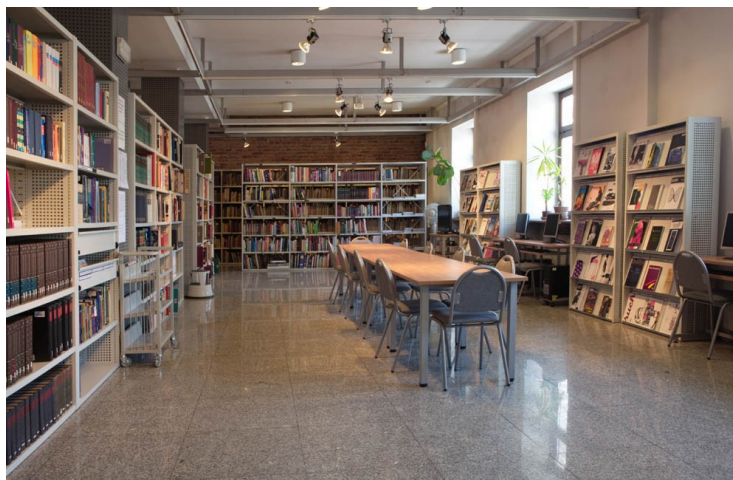
Fot. 2. Wnętrze Biblioteki Głównej UA w Poznaniu

Ważnym celem, jaki stawia sobie Biblioteka Główna, jest ułatwienie czytelnikom dostępu do zasobów bibliotecznych. Od 2004 r. działa strona internetowa Biblioteki Głównej oraz elektroniczny katalog komputerowy umożliwiające wyszukiwanie zbiorów, dokonywanie zamówień magazynowych, prolongat, rezerwacji, przypomnień i monitów. Do dyspozycji czytelników oddano cztery stanowiska internetowe, dwa stanowiska do przeglądania filmów na nośnikach VHS i CD/DVD, trzy stanowiska do przeglądania baz i cztery stanowiska do przeglądania katalogu komputerowego, a w czytelni użytkownicy mogą korzystać ze zbiorów w wolnym dostępie.