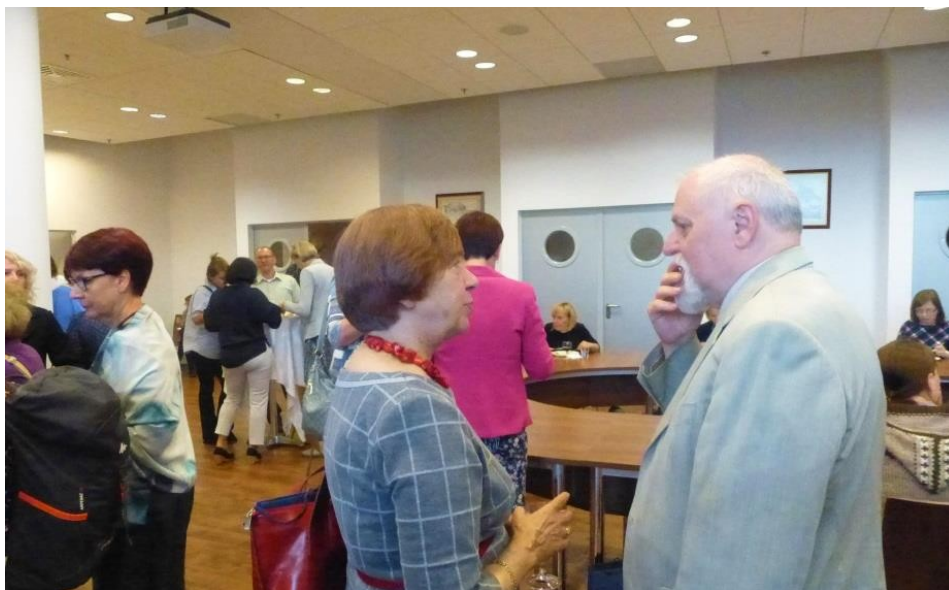
II. 3. Rozmowy kulturalowe w pierwszym dniu konferencji