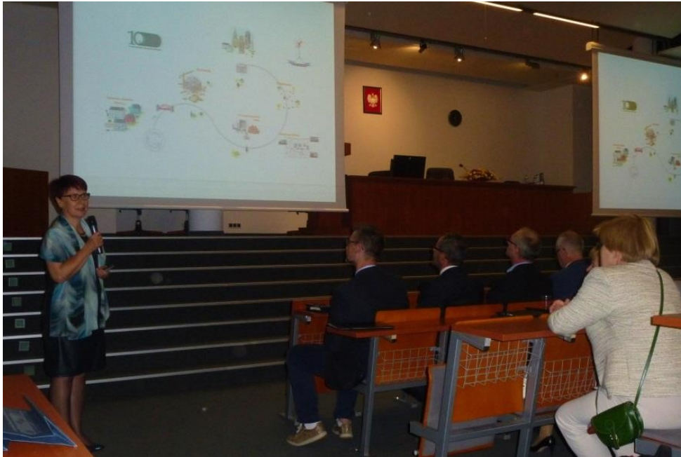
II. 4. Prezentacja z okazji 10-lecia gmachu Biblioteki Głównej UG