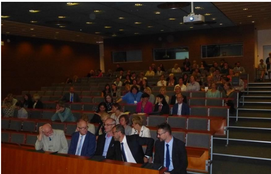
Il. 2. Sala obrad