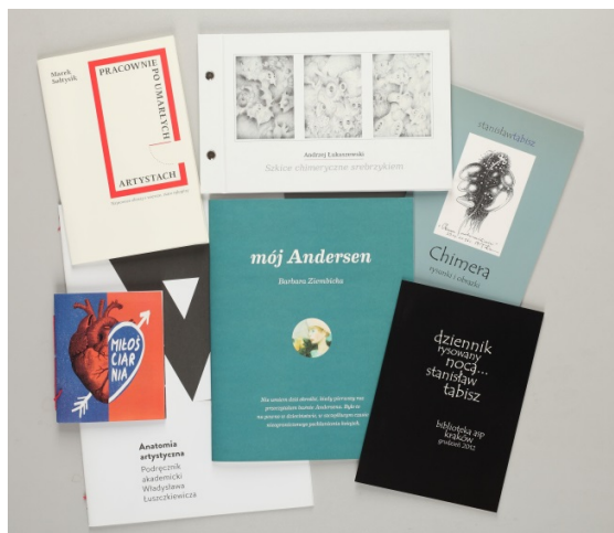
Il. 19. Katalogi wystaw wydane przez Bibliotekę Główną ASP.

Jedną z form działalności Biblioteki Głównej ASP w Krakowie, podobnie jak wszystkich bibliotek artystycznych, jest szeroko rozumiana działalność wydawnicza. Większość ekspozycji ma charakter propagujący życie artystyczne, ale również unikatowe zbiory i kolekcje ze swoich zbiorów. Biblioteka ma w swoim dorobku wydawniczym liczne katalogi wystaw. Katalogi te mają bardzo zróżnicowaną formę wydawniczą, począwszy od krótkich, kilkustronicowych wydawnictw informujących o odbywającej się ekspozycji, po profesjonalne ilustrowane publikacje zawierające wstęp, treść właściwą i obszerną dokumentację fotograficzną wystawy czy zbiorów. Większość katalogów wystaw opatrzona jest numerem ISBN i drukowana w nakładzie od 50 do 100 egzemplarzy. Zdecydowaną większość stanowią katalogi wystaw indywidualnych. Wśród nich znajdziemy katalogi wystaw takich artystów jak: Stanisław Tabisz, Adam Wsiołkowski, Stanisław Rodziński czy Władysław Pluta.