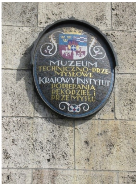
II. 2. Oryginalna tablica Muzeum Techniczno-Przemysłowego znajdująca się na fasadzie budynku.