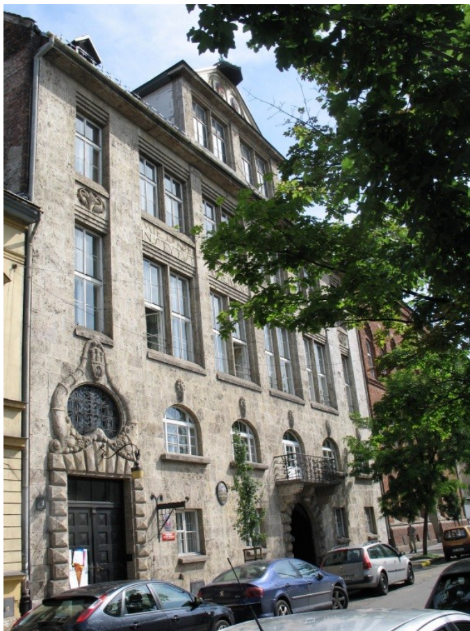
Il. 1. Budynek przy ul. Smoleńsk 9, w którym mieści się Biblioteka Główna ASP.

Ta największa i najstarsza spośród bibliotek szkół artystycznych w Polsce ma ponad 180 tysięcy woluminów książek oraz innych obiektów, w tym zbiory specjalne zgromadzone w Gabinetach Plakatów i Gabinetach Rycin: plakaty, kolekcje grafiki, rysunków i fotografii, wydania oraz druki bibliofilskie, okładki książkowe.