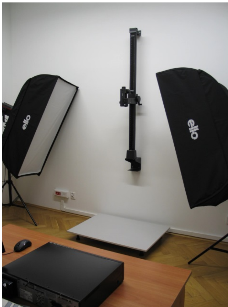
Il. 12. Pracownia Digitalizacji Zbiorów

System ma dwie metody wyszukiwania: prosty i zaawansowany, dodatkowo funkcję ewidencji zbiorów, co daje możliwość tworzenia elektronicznego inwentarza oraz statystyk zbiorów specjalnych. Do katalogu elektronicznego zbiorów specjalnych do tej pory wprowadzono ok. 32 tys. obiektów 4 .