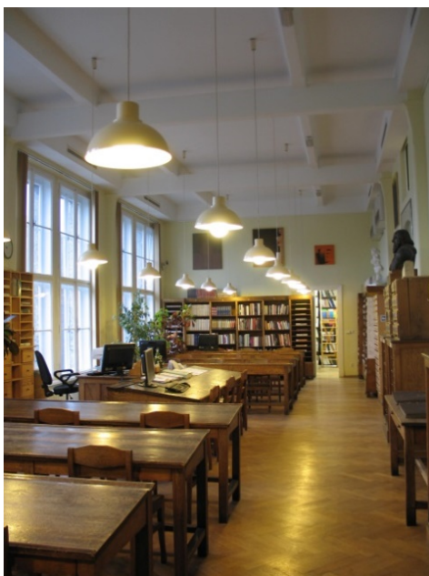
Il. 4. Czytelnia Biblioteki Głównej ASP