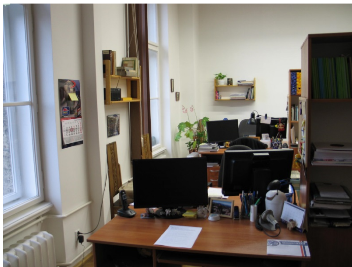
Il. 11. Pracownia Ewidencji i Katalogowania Zbiorów

Od 2004 r. opracowaniem komputerowym objęte są wszystkie nowe wpływy do Biblioteki Głównej. Wszystkie opisy bibliograficzne zaopatrzone są w hasła przedmiotowe. Każdy rekord w katalogu elektronicznym ma określony status, tj. „dostępny” lub „nie wypożycza się”. Do katalogu internetowego do tej pory wprowadzono ponad 32 tys. książek. Biblioteka Główna ASP od samego początku uczestniczy w budowaniu centralnego katalogu polskich bibliotek naukowych NUKAT, opartego na koncepcji zbiorowego katalogowania w bazie centralnej i udostępnianiu gotowych danych do kopiowania.