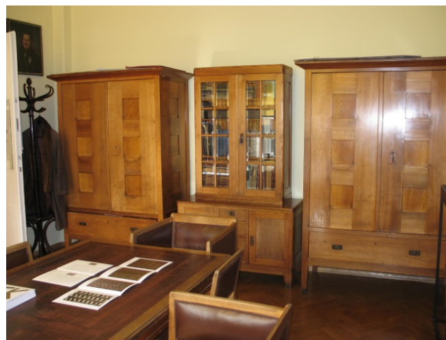
Il. 6 i 7. Gabinet Dyrektora Biblioteki Głównej ASP