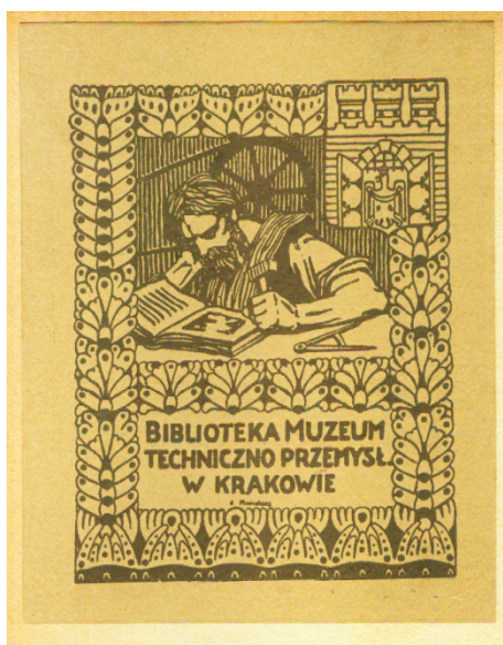
II. 3. Ekslibris Biblioteki Muzeum Techniczno-Przemysłowego projektu Karola Homolacsa.

Biblioteka została przekształcona w Bibliotekę Główną ASP w Krakowie. W jej skład poza dawnymi zbiorami Biblioteki Muzeum Techniczno-Przemysłowego wchodziły: zbiory biblioteki dawnej Szkoły Sztuk Pięknych w Krakowie (założonej w 1818 r.), późniejszej Akademii Sztuk Pięknych oraz księgozbiór i kolekcja grafiki Heleny Dąbczańskiej, pozyskana na początku XX w. Cennym uzupełnieniem zbiorów jest dar przekazany przez wybitnego niemieckiego