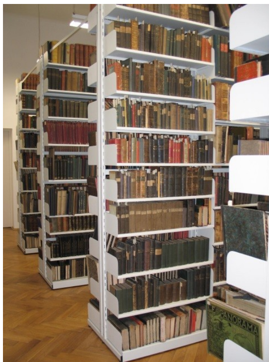
II. 8. Magazyn Biblioteki