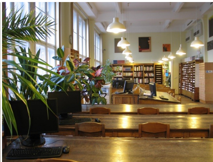
Il. 5. Czytelnia Biblioteki Głównej ASP