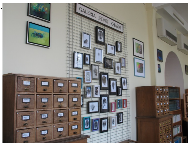
Il. 17 i 18. Galeria Jednej Książki