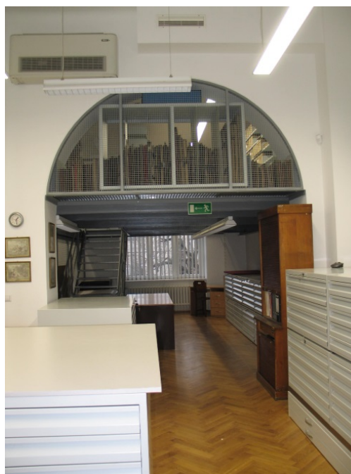
II. 9 i 10. Magazyn Zbiorów Graficznych.