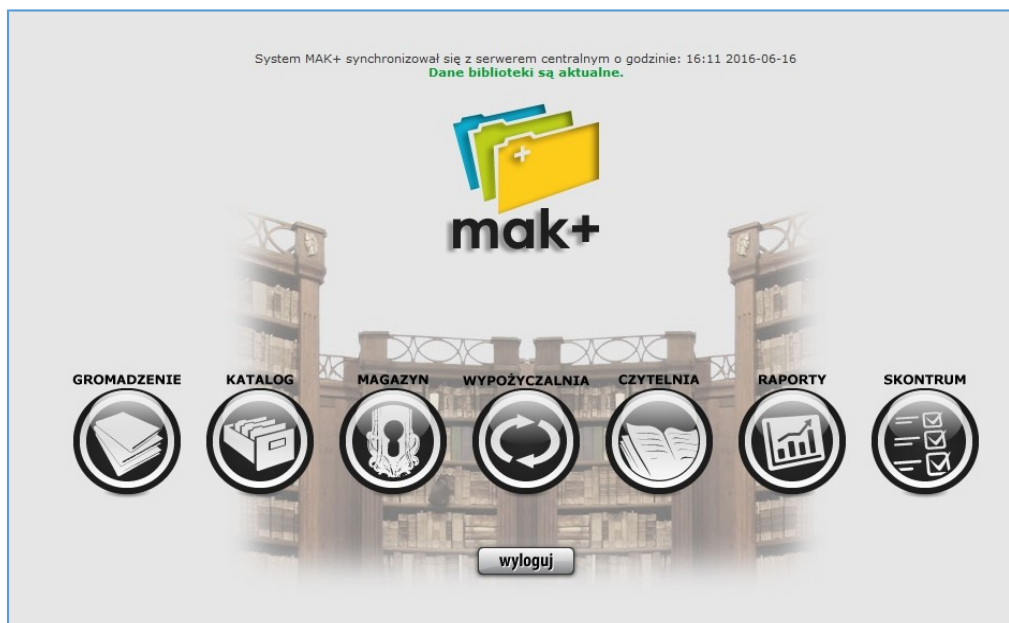
Il. 1. Rzut z ekranu systemu MAK+

MAK+ zawsze jest dystrybuowany jako kompletny system biblioteczny, zawierający wszystkie aktualnie dostępne moduły oraz funkcjonalności, umożliwiające kompleksową obsługę procesów związanych z książką i czytelnikiem w bibliotece. Każdy z modułów to osobne uprawnienia przyznawane bibliotekarzowi w zależności od pełnionych przez niego funkcji. O zakresie przyznanych uprawnień decyduje dyrektor biblioteki i przekazuje te informacje technikowi, instalującemu system.