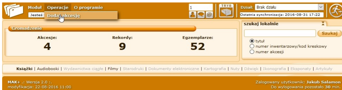
II. 2. Moduł Gromadzenie Źródło: System biblioteczny MAK+.

Gromadzenie jest jednym z najnowszych modułów w systemie bibliotecznym MAK+. Powstał w 2014 r. jako odpowiedź na zapotrzebowanie dużych bibliotek miejskich i wojewódzkich, które w swoich strukturach mają wyodrębnione działy gromadzenia zbiorów. Funkcjonalności tego modułu sprowadzają się przede wszystkim do manualnego wprowadzania danych z konkretnej faktury zakupowej i do tworzenia z niej jednolitej akcesji zakupu. Moduł ten nie jest w żaden sposób połączony z Hybrydowym Katalogiem Centralnym (HKC), ponieważ bibliotekarz na tym etapie wprowadza tylko szczątkowe dane dotyczące opisu bibliograficznego. Praca w tym module systemu skupia się przede wszystkim na wprowadzaniu kompletnych danych dotyczących lokalizacji egzemplarzy (numer filii, nazwa inwentarza), sposobu nabycia, ceny, sygnatury, daty wpływu, numeru faktury czy numeru akcesji.