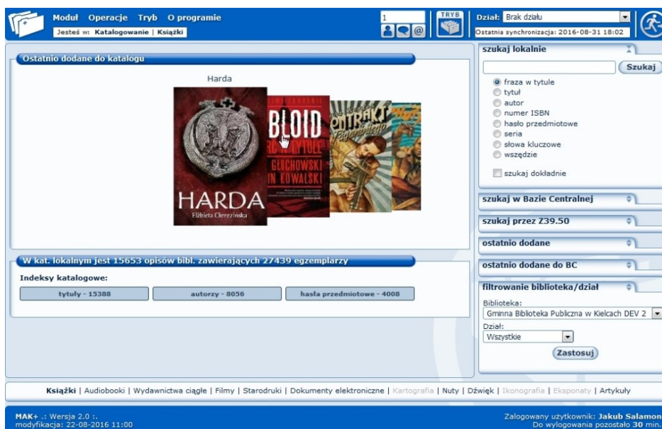
II. 3. Moduł Katalog