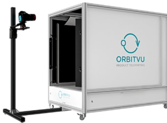
Fot. 2. Studio fotograficzne Alphashot XLI Led

aparaty Nikon D800E, obiektywy stałogniskowe, zmienno-ogniskowe i fish eye, a także odrębne stanowisko do tworzenia Fotografii 360° Alphashot XL 360 firmy Orbitvu.