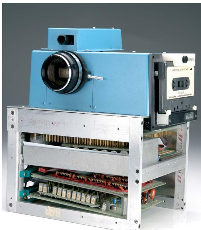
Fot. 1. Pierwszy cyfrowy aparat fotograficzny opracowany w 1975 r.

Mówiąc o fotografii cyfrowej, warto przypomnieć, że jej początki sięgają roku 1969 – wówczas wynaleziono matrycę światłoczułą typu CCD 5 . Pierwszy egzemplarz takiego sensora posiadał jedynie osiem elementów światłoczułych, które były umieszczone w jednym rzędzie, co nie pozwalało na realne wykorzystanie go w aparatach fotograficznych. Za prototyp aparatu cyfrowego uważa się urządzenie, które powstało w 1975 r. w laboratoriach Kodaka. Aparat ważył 3,6 kg, był wyposażony w obiektyw z kamery filmowej i rejestrował zdjęcia w rozdzielczości 0,01 megapiksela na kasecie magnetycznej, co zajmowało 23 sekundy 6 . Powstałe fotografie można było odczytywać w oddzielnym, podłączonym do telewizora urządzeniu.