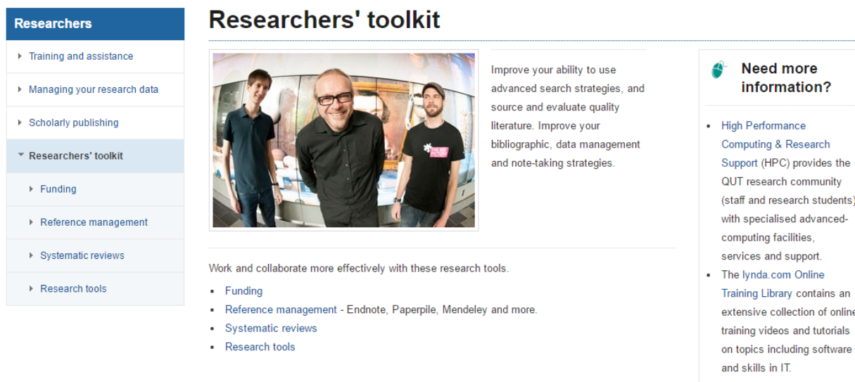
Rys. 6. SEKCJA 4: Zestaw narzędzi przydatny naukowcom.